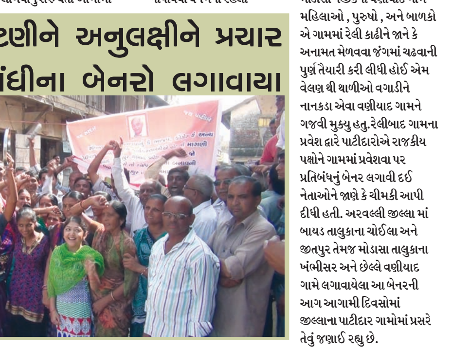
આગામી ચૂંટણીને અનુલક્ષીને પ્રચાર માટે પ્રવેશબંધીના બેનરો લગાવાયા

અરવલ્લીના વિવિધ ગામોમાં લાગવાનું શરૂ થતાં આગામી સ્વરાજની ચૂંટણીઓમાં ઉમેદવારી નોંધાવવા થનગની રહેલા