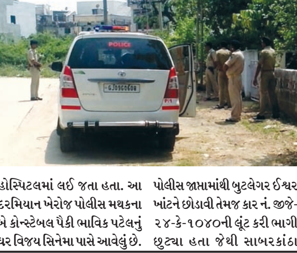
ખેડબ્રહ્મામાં પોલીસ પર હુમલાના સ્થળની ડી.એસ.પી. દ્વારા તપાસ

ખાંટને પકડી પાડ્યો હતો. આ બુટલેગરની તબીયત લગ્ગડતા સારવાર માટે ખેડબ્રહ્માની સરકારી હોસ્પિટલમાં લઈને આવી હતી અને ત્યાં વાહનમાં ઘસી આવેલા આઈથી દસ બુટલેગરોએ પોલીસ પર હથિયારો વડે હુમલો કર્યો હતો અને