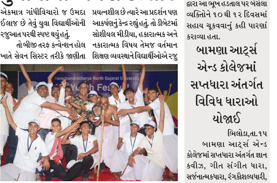
ઉત્તર ગુજરાત યુનિવર્સિટીના યુવા મહોત્સવમાં યુવાનોનો અનેરો ઉત્સાહ

પાલનપુર, તા. ૧૫ હેમચંદ્રાચાર્ય ઉત્તર ગુજરાત યુનિવર્સિટીમાં ગજરોજી શરૂ થયેલા ૨૭માં યુવા મહોત્સવમાં ૧૦૦ કોલેજોના ૨ હજાર વિદ્યાર્થીઓએ ૨૫ ઈવેન્ટમાં યુવાનોનો તળવરાટ, ઉત્સાહ અને સંસ્કૃતિની સાથે સાથે ગાંધીવિચારોને પણ યુવાનોએ પ્રગટ કર્યું હતું. યુવાનોએ બીજા દિવસે સ્કીટ, એકાંકી, શાસ્ત્રીય નૃત્ય, પ્રાદેશીક વૃંદવાદન, સમૂહગીત, ડીબેટ, કલે મોડલીંગ, ઉપરાંત નાટકોમાં પોતાનું કૌતલ દાખવ્યું હતું. ખાસ કરીને આજે ૨જી કરેલા એકાંકી અને નાટકોમાં ગાંધીવિચારોને અનુરૂપ શીમ પર વિવિધ રજૂઆતો થઈ હતી અને આ રજૂઆતોએ ભારે આકર્ષણ જમાવ્યું હતું. ખાસ કરીને ગાંધીજીના વિચારોને કવિતાની પંક્તિઓ દ્વારા રજૂ કરી યુવાનોએ કુદપતિને પણ આકર્ષીત કર્યા હતા. આ યુવાનોએ આજના આ જમાનામાં ગાંધીવિચારોને ઉત્તમ ઈલાજ ગણાવ્યો હતો. સમાજમાં સદભાવ, ભાઈચારોટટી રહે તે માટે