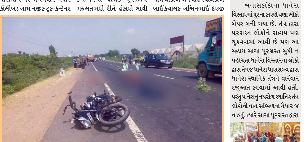
મંગળવારે બપોરે સર્જાયેલા ગમખવાર અકસ્માતમાં મહિલાના શરીરના ફૂર્યે-ફૂર્યા ઉડી ગયા હતા. મહિલાનું શરીર ધડથી અલગ થઈ જતાં અને માંસના લોચેલોયા માર્ગ પર વેર-વિખેર થતાં અકસ્માતના પગલે દોડી આવેલા લોકોના શરીરમાંથી કંપારી છૂટી ગઈ હતી.