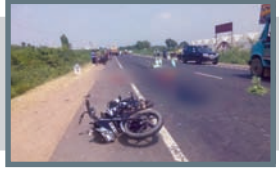
કોલીખડ પાસે ટ્રકે બાઈકસવાર દંપતિને અડફેટે લેતા પત્નીનું મોત