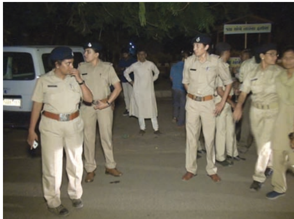
ગયો હતો. પોલીસનું ઘાડુ ઉતારી દેતા મહિલાઓ થાળી વેલણ વડે વિરોધ કરી શકી ન હતી અને આખરે વિરોધ પ્રદર્શન કર્યા વિના જ મહિલાઓએ સ્થળ છોડી દીધું હતું.

કરી દેવાયો હતો. મહિલાઓનો કાર્યક્રમ હોવાને કારણે મહિલા પોલીસને ઉતારી દેવામાં આવી હતી. પોલીસને જોઈને થાળી-વેલણ લઈને આવેલી મહિલાઓએ ધીરે ધીરે થાળી-વેલણ સંતાડી વાહનોમાં પાછા મુકી દીધા હતાં. વિરોધ પ્રદર્શન યોજાય તે પહેલા જ પોલીસે સહાયતા દાખવીને સ્થળ પર પહોંચી વિડીયોગ્રાફી શરૂ કરી દેતા પાટીદાર મહિલાઓનું આ મિશન 'વેલણ વિદ્રોહ' ફલોપ