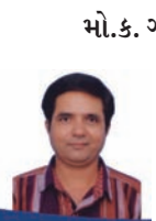
ગાંધી ૧૦૦ ડો. રાજેન્દ્ર બાની

પ્રત્યેક ભારતીયોના હૃદય સુધી પહોંચાડી તે સમયે તેમણે આંતર જ્ઞાતિ લગ્નો માત્ર ઉચ્ચ ગણપતી જ્ઞાતિ-જ્ઞાતિ કે નિમ્ન ગણપતી જ્ઞાતિ - જ્ઞાતિ વચ્ચે નહીં પણ વર્ણાશ્રમમાં જે રીતે ઉચ્ચનીચનો ક્રમ દર્શાવ્યો છે તેમાં ધરમૂળથી પરિવર્તન લાવવા માટે સર્વજ્ઞ અને અસ્પૃશ્ય જ્ઞાતિજનો વચ્ચે લગ્ન સંબંધની તરફ દારી કરી હતી. અને એ ત્યાં સુધી કે જો આવા લગ્ન ના થતા હોય તો તેમાં તેઓ ઉપસ્થિત નહીં રહે એમ જાહેર કર્યું હતું. અને એ જાહેરાતને ત્યાં સુધી વણગી રહ્યા હતા કે મહાદેવ દેસાઈના પુત્ર નારાયણ દેસાઈના લગ્ન તેમની જ અનાવિલ જ્ઞાતિની કન્યા સાથે થતાં હોઈ તેમનાં લગ્નમાં, તેઓ ઉપસ્થિત રહ્યા ન હતા. બાપુના 'બયુડા' તરીકે ઓળખાયેલા નારાયણભાઈએ આ વાત કલ્ચરલ ફોરમે બેસાડેલી 'ગાંધીકથા' માં કહી હતી એ સ્મરણ ગાંધીનગરાઓને યાદ હશે!