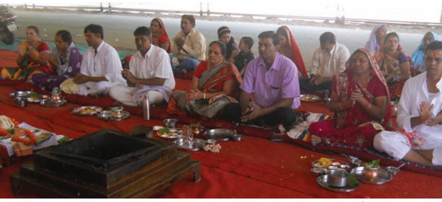
ભુવનેશ્વર યુવક મંડળ અને સૌરાષ્ટ્ર કચ્છ સમાજસેવા દ્વારા ભુવનેશ્વર મહાદેવ મંદિર, સેક્ટર-૬ ખાતે અનંત ચતુર્દશી નિમિત્તે ગણેશયાગનું આયોજન કરવામાં આવ્યું હતું.