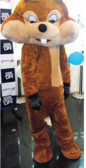
પ્રસંગના ઉજવણી માટે મુક્તા એટુ સિનેમાએ શુક્રવાર તા. ૧૯ સાપ્ટેમ્બરથી શરૂ કરીને સોમવાર તા. ૨૧ સાપ્ટેમ્બર સુધી ચાર દિવસ ઉજવણીનું આયોજન કર્યું હતું. સિનેમા ચાહકો ટેટુ મેકીંગ, હેર બ્રેઈડીંગ, સ્ટાઈલીંગ, નેઈલ આર્ટ ફન ગેસ અને મહેંદી ડિઝાઈનીંગની સાથે સાથે અન્ય કાર્યક્રમોમાં પણ સામેલ થયા હતા. દરેક વિજેતાનું મુક્તા એટુ સિનેમાના પ્રતિનિધિ દ્વારા બહુમાન કરાયું હતું.