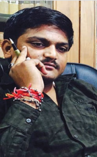
ગાંધીનગર તા. ૨૮ બાયડ પાસેના તેનપુર ગામમાં સભા બાદ હાઈકોર્ટ પટેલ ગુજરાતમાં પાટીદાર આંદોલનની હડતરમાં ગુમ થવાના મામલે થયેલી હેબિયસ કોર્પસ દાખલ કરી હતી જેની આજે હાઈકોર્ટમાં સુનાવણી બાદ હાઈકોર્ટ પટેલની ધરપકડ થવાની હોવાની શક્યતાને અનુલક્ષી હાઈકોર્ટ બહાર પાટીદારો દ્વારા શક્તિ પ્રદર્શન કરવામાં આવશે તેવો મેસેજ પણ સોશિયલ મીડીયા પર આજે વાયરલ થયો હતો. હાર્દીકના ફોટા સાથે પાટીદાર આંદોલન મહીલા સમિતિના નામે ડાકલ કરતો આ મેસેજ ફરતો થયો હતો.

સોશિયલ મીડીયામાં અનેક મેસેજો સાથે વાયરલ થતા હોવાનું ધ્યાને આવ્યું છે. જયારે અરવલ્લીના