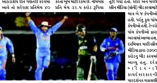
આગાઉ યુકવામા આવેલી રકમ કરતા પૂબ મોટી રકમ છે. નીમબસે પ્રતિ મેચ ૩૨.૫ કરોડ રૂપિયા

મુંબઈ, તા. ૨ સ્ટાર ઇન્ડિયાએ ભારતમાં રમાનારી મેચો માટે ભારતીય ક્રિકેટ પ્રસારણ અને ડિજિટલ અધિકારો મેળવી લીધા છે. ૬ વર્ષ માટે સ્ટાર ઇન્ડિયાએ ૩૮૫.૧ કરોડ રૂપિયામાં બીસીસીઆઈ મીડિયા અધિકારો મેળવી લીધા છે. આની સાથે જ છેલ્લા કેટલાક દિવસથી ચાલી રહેલી અટકળોનો અંત આવી ગયો છે. સ્ટાર યુપી આજે યોજાયેલી ગળાકાપ સંધીમાં મહત્તી સ્કીન મીડિયા (સોની)ને ૫૪૭.૯૮ આપીને ઘરમાં ગણે રમાનારી ભારતની આંતરરાષ્ટ્રીય ક્રિકેટ મેચોના ૬ વર્ષના પ્રસારણ અને ડિજિટલ અધિકાર મેળવી લીધા હતા. રણજી ટ્રોફી,