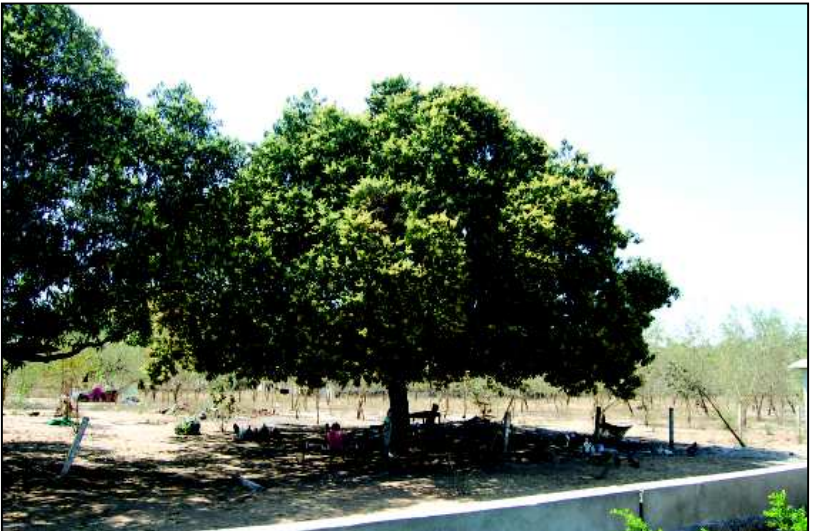
‘આમ કે આમ ઔર ગુલિયો કે ભી દામ’ એવી કહેવત ફળોના રાજા કેરી માટે કહેવાય છે. કેરીમાં આટલી ખૂબી ક્યાંથી આવી? એનો જવાબ છે કે કેરીના વૃક્ષમાં જ એટલે કે આંબામાં જ આ સંસ્કાર છે, પછી કેરીમાં નો એ આવે જ ને! આ તસવીર જ જોઈ લ્યો. ઉનાળાની ઋતુમાં પાકતી કેરીઓનો વેપાર કરવાના હેતુથી આંબો ભાડે રાખનારા પરિવારો ગાંધીનગરમાં ઘણા. આવા જ એક પરિવારની આ તસવીર છે. કાચી કેરીનો વેપાર તો ચાલુ જ છે, કેરી પાકશે ત્યારે વળી વધુ વેપાર થશે અને એથીય અગત્યની વાત એ કે કેરી પાકે ત્યારની વાત ત્યારે અન્યારે તો આ પરિવારને રહેવા માટે એક સરસ મજાની કુદરતી છત મળી ગઈ છે! આને કહેવાય ‘આમ કે આમ ઔર....’

ગાંધીનગર, તા. ૧૧ રાજ્ય સરકારના વર્ગ-૪ના કર્મચારીઓને રૂ. પાંચ હજાર વ્યાજમુક્ત અનાજ પેશગી આપવાનો નિર્ણય રાજ્ય સરકારે કર્યો છે. આજે મળેલી રાજ્ય મંત્રીમંડળની બેઠકમાં લેવાયેલ આ નિર્ણયની વિગતો આપતાં રાજ્ય સરકારના પ્રવક્તા મંત્રીએ જણાવ્યું હતું કે છેલ્લા કેટલાક સમયથી મોંઘવારીમાં કમ્પરતો વધારો થઈ રહ્યો છે. આ ભાવવધારાને પરિણામે સામાન્ય માણસ માટે ખાદ્યકોષ્ટકની યોજવસ્તુઓ જેવી કે અનાજ, તેલ, ખાંડ વગેરેના ભાવ આસમાને પહોંચ્યા છે. આ પરિસ્થિતિમાં નવો માલ બજારમાં આવે ત્યારે આખા વર્ષ માટે જરૂરી અનાજ તેલ વગેરે ભરી લેવાની પદ્ધતિ આજે છે. અભૂતપૂર્વ ભાવ વધારાને કારણે આખા વર્ષની આ ખરીદી પણ સારી એવી નાણાકીય જોગવાઈ માંગી લે છે. ખાસ કરીને નોકરીયાત વર્ગ માટે અને તેમાંય યોગ્ય વર્ગના કર્મચારીઓ માટે પોતાની બચત કે અન્ય સાધનોમાંથી આ ખર્ચ માટે રકમ ફાળવણી મુશ્કેલ છે. આ બાબતોને ધ્યાને લઈ રાજ્ય સરકારે ચાલુ વર્ષે ખાદ્ય સામગ્રીકરીદવા માટે પાંચ હજાર રૂપિયાની વ્યાજમુક્ત સહાય અનાજ પેશગી તરીકે ચૂકવવાનો રાજ્ય સરકારે નિર્ણય કર્યો છે. રાજ્યમંત્રી મંડળની બેઠકમાં લેવાયેલ આ નિર્ણયથી પંચાયત, ગ્રાન્ટ ઈન એઈડ સંસ્થાઓના વર્ગ-૪ના કર્મચારીઓ સહિત અંદાજે ૪૧ હજાર જેટલા વર્ગ-૪ના કર્મચોગીઓને વીસ કરોડ રૂપિયાથી પણ વધુ સહાય તાકાલિ ચૂકવાશે.