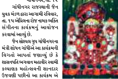
ગાંધીનગર, તા. ૧૨ ગાંધીનગર રાજસ્થાની જૈન યુવક મંડળ દ્વારા આગામી રવિવાર, તા. ૧૫ એપ્રિલના રોજ નામક ભક્તિ સંગીતના કાર્યક્રમનું આયોજન કરવામાં આવ્યું છે.