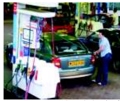
કિંમતમાં રૂપિયા ૮નો વધારો થઈ ડીઝલ પર લીટરદીઠ ૮૭ પૈસા અને પેટ્રોલ પર ૧.૪૪ રૂપિયા પ્મળે છે.