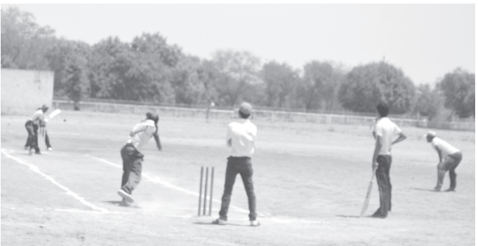
આંબેડકર કપ ક્રિકેટ ટુર્નામેન્ટ-૨૦૧૨નો સેક્ટર-૧૩ વિનયન કોલેજ ગ્રાઉન્ડ ખાતે સોમવારથી આરંભ કરવામાં આવ્યો છે. ટુર્નામેન્ટ ૨૦ એપ્રિલ સુધી ચાલશે.