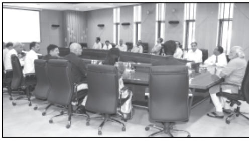
મિશન સફળ બનાવવા તથા ગુણોત્સવને આત્મસાત કરી ગુણોના પુજારી બનવાના શિક્ષકોને પ્રેરક દ્રવ્યોનો આપ્યા હતા.

સર્વશિક્ષા અભિયાન હેઠળ ઉપગ્રહ દ્વારા શિક્ષક સજ્જતા તાલીમ શિબિરનો મુખ્યમંત્રી નરેન્દ્ર મોદીના હસ્તે પ્રારંભ. ગાંધીનગર, તા. ૨૩ મુખ્યમંત્રી નરેન્દ્ર મોદીએ આજે ગુજરાત ૨.૨૧ લાખ જેટલા પ્રાથમિક શિક્ષકોના ઉપગ્રહ મારફતે શિક્ષક સજ્જતા તાલીમ શિબિરનો પ્રારંભ કરાવતાં પ્રાથમિક શિક્ષકોને ગુણવાન બનાવવા, પોતાના શિક્ષક તરીકેના સામર્થ્યની પ્રતિતી કરાવવાનું પ્રેરક આહ્વાન કર્યું હતું. ગાંધીનગરમાં બાઈસેજ સ્ટુડિયોમાંથી એજ્યુસેટ-ઉપગ્રહ મારફતે રાજ્યભરના ૪૨૬૮ સીઆરસી કેન્દ્રોમાં ઉપસ્થિત રહીને તમામ પ્રાથમિક શાળાના દશ દિવસની તાલીમથી બાળકોની ઉજ્જવળ આવતીકાલના ઘડતર માટેનું માનનીય માર્ગદર્શન મુખ્યમંત્રીએ વાર્તાલાપમાં આપ્યું હતું. સાચા અર્થમાં શિક્ષક પોતે જ નિત્યનૂતન શૈક્ષણિક પ્રવાહો અને પરિવર્તનોને આત્મસાત કરનારો વિદ્યાર્થી છે એમ જણાવી મોદીએ ધો. ૫ અને ૮ના આ વર્ષના નવા શૈક્ષણિક અભ્યાસક્રમ, પાઠ્યક્રમ અને સર્વ શિક્ષા અભિયાનનું બાળક તો શક્તિ સામર્થ્યનો પૂંજ છે અને શિક્ષકનો આરાધ્યવેદ તથા શાળાનું કેન્દ્રબિન્દુ બાળક છે તેથી બાળક અને શિક્ષકનો નાતો અદ્વૈત છે એની પ્રેરણા આપતા મુખ્યમંત્રીએ જણાવ્યું કે હોશિયાર બાળક માનીતા અને નબળાની ઉદાસિનતા એવી બે આંખ શિક્ષકની હોઈ શકે જ નહીં, શાળામાં તમાવ કેવિસંવાદિત બને નહીં.