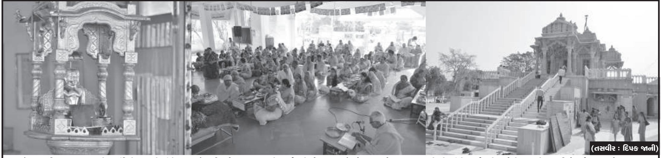
જૈનમ જ્યોતિ શાસનમ્ - મહાવીર જ્યોતિની ઉજવણી ગાંધીનગરના જૈન પરિવારો દ્વારા ધામધૂમથી કરાઈ હતી. સેક્ટર-૨૨ જૈન દેરાસર ખાતે ભગવાન મહાવીરની આંગી કરાઈ હતી. વહેલી સવારથી જ ભાવિકો દર્શન-પૂજા માટે ઉમટવા હતા. (તસવીર : દિપક જાની)