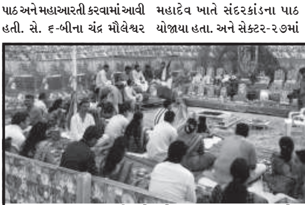
હનુમાન જયંતિએ શોભાયાત્રામાં ભક્તો ઉમટ્યા

ગાંધીનગર, તા. ૪ આજે ગાંધીનગરમાં શહેર સહિત સમગ્ર તાલુકામાં હનુમાન જયંતિની ઉલ્લાસપૂર્ણ ઉજવણી કરવામાં આવી હતી. શહેરના હનુમાન મંદિરો, રામજી મંદિરો અને મહાદેવના મંદિરો પર દર્શનાર્થીઓ વહેલી સવારથી ઉમટી પડ્યા હતા. ઠેક ઠેકાણે મહાઆરતી હનુમાન ચાલીસાના પાઠ, સુંદરકાંડના પાઠ અને માઝતિ યજ્ઞનું આયોજન કરવામાં આવ્યું હતું. ચંદ્રગ્રહણના કારણે સવારે ૧૧ થી ૮ મંદિરો બંધ રહેવાના હોઈ શ્રદ્ધાળુઓ વહેલી સવારે જ દર્શન-પૂજા-અર્ચના કરવા પહોંચી ગયા હતા.