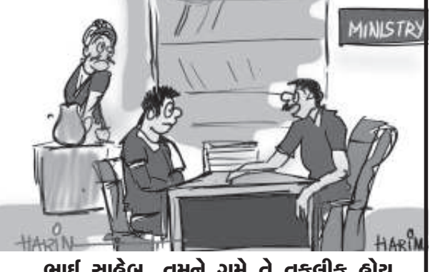
ભાઈ સાહેબ, તમને ગમે તે તકલીફ હોય... પણ અમે પ્રધાનમંત્રી રાહત ફંડમાંથી તમને રાહત ન આપી શકીએ...!!