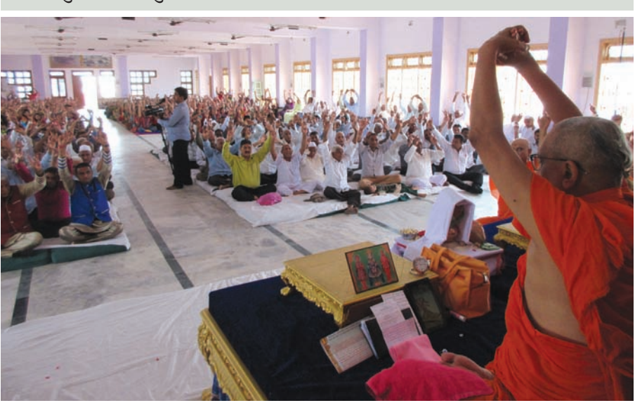
શ્રી મુક્ત જીવન સ્વામીભાષા સ્મૃતિ મંદિર વિશ્વશાંતિ કેન્દ્ર રજત મહોત્સવ અંતર્ગત કલોલ તાલુકાના મોખાસણ ગામમાં આવેલ સ્વામિનારાયણ મંદિરના ૨૬મા પાટોત્સવ નિમિત્તે પર્યાવરણ જાગૃતિ રેલી તેમજ બે દિવસીય શિબિરનું આયોજન કરવામાં આવ્યું હતું. જેમાં મોટી સંખ્યામાં લોકો જોડાયા હતા. રેલીના અંતે પ.પૂ. આચાર્ય સ્વામીજી મહારાજે જણાવ્યું હતું કે વૃક્ષ પ્રાણવાયુ આપે છે. એક મનુષ્ય દિવસમાં બે બોટલ જેટલો પ્રાણવાયુ બગાડે છે. જેનું શુદ્ધિકરણ પરોપકારી વૃક્ષો કરે છે. જે મનુષ્ય જીવનમાં વૃક્ષોનો ઉછેર નથી કરતો તે વાસ્તવમાં તેનું જીવન ન જીવ્યો બરાબર છે. તથા મનુષ્યોએ જીવનમાંથી વ્યસનોને તિલાંજલી આપવી જીવનના સદ્ગુણો પ્રાપ્ત કરવા.