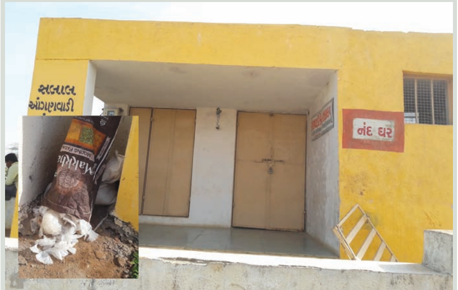
દારૂ ધામ બનાવ્યું છે અને દેશી તથા વિદેશી દારૂ જાહેરમાં વેપલો થાય છે. સલાલ ખાતે આવેલ આંગણવાડી નં-૫ સરકાર દ્વારા લાખ્ખો રૂપિયાની સહાયથી બાળકોને ભણવા-રમવા માટેનું વિદ્યા મંદિર કે જે નંદઘર બનાવવામાં આવેલ છે તે પ્રાંતિજ પોલીસ અને તંત્રની નિષ્ક્રિયતાનો ઉત્તમ નમુનો પ્રાંતિજ તાલુકાના સલાલ ગામે જોવા

દેશી તથા વિદેશી દારૂ જાહેરમાં વેચાતો હોવા છતાં પોલીસની આંખે હમ્તાનાં પાટા : સરકારી મિલકત ઉપર બુટલેગરોનો કબજો પ્રાંતિજ, તા. ૩ સાબરકાંઠા જિલ્લાના પ્રાંતિજ તથા તાલુકામાં પાણીની જેમ દેશી તથા વિદેશી દારૂનું ધુમ વેચાણ છતાં પોલીસ માત્ર હમાની લ્યાહમાં ચુપકી સાધીને બેઠી છે ત્યારે સલાલમાં તો બુટલેગરોએ નંદઘર નેજ મળે છે. અને સરકાર દ્વારા બનાવેલ નવીન મકાન (નંદઘર) જાણે બાળકો માટે નહીં પણ બુટલેગરો માટે બનાવ્યું હોય તેવું સ્પષ્ટ પણે જોઈ શકાય છે. અને જાહેરમાં દેશી તથા વિદેશી દારૂ પાણીના પાઉચ અને પેપ્સીની બોટલની જેમ વેચાય છે ત્યારે જિલ્લા પોલીસ