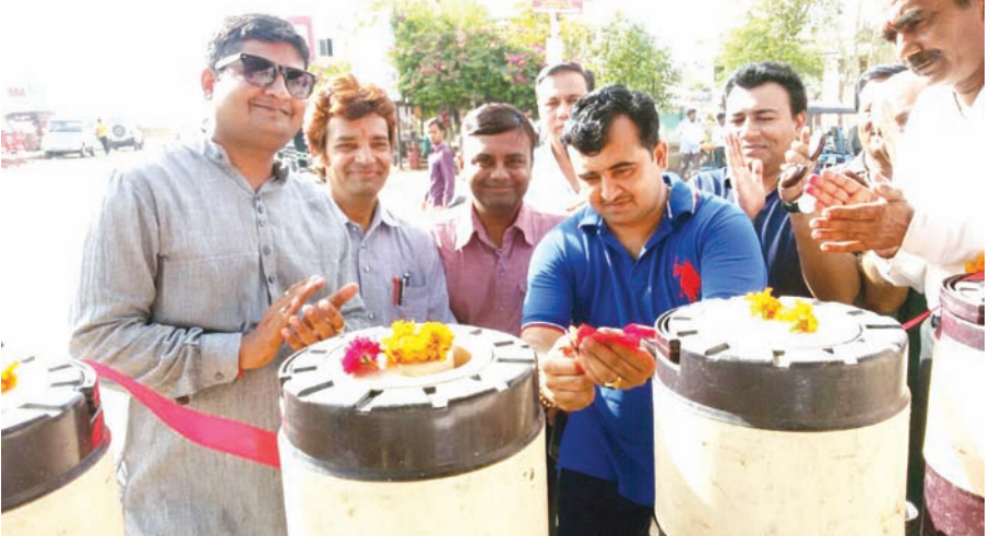
ડીસા ગાયત્રી મંદિર પાસે ઠંડા પાણીની પરબ ખુલ્લી મુકાઈ