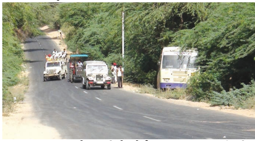
પાવડાસણ ગામ પાસે બસની બ્રેક ફેઈલ થતા બસ ખાડામાં પડી