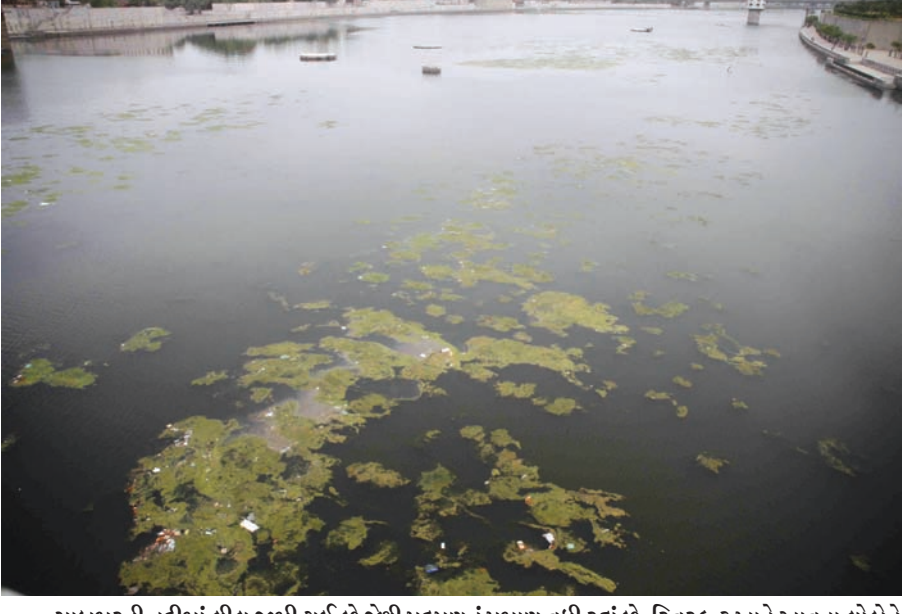
સાબમરતી નદીમાં લીલ જામી ગઈ છે જેથી પ્રદૂષણનું પ્રમાણ વધી રહ્યું છે. રિવરફ્રન્ટ ખાતે આવતા લોકોને પણ મુશ્કેલી નડી રહી છે.