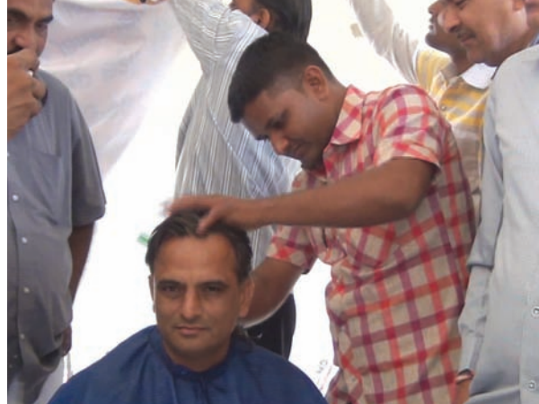
પાલનપુર, તા. ૬ પાટીદારો હવે આંદોલનના નવા રાઉન્ડની તૈયારીમાં આવી ગયા છે. આ સંદર્ભમાં પાટીદારો હવે વધુમાં વધુ કઠોર બની ગયા છે. આજે પાલનપુરમાં પાટીદારોએ મુંડન કાર્યક્રમની શરૂઆત કરી હતી.

વિરોધ પ્રદર્શન કરનાર ૨૧થી વધુની ધરપકડ : ઉગ્ર વિરોધ પ્રદર્શન કાર્યક્રમમાં મોટી સંખ્યામાં પાટીદારો જોડાયા : મુંડન બાદ રાજ્ય સરકારના બેસણાનો કાર્યક્રમ શરૂ જ રહેશે તેમજ હાર્ટિક પટેલને સરકાર દ્વારા છોડવામાં નહી આવે તો હજુ પણ જલદ કાર્યક્રમ અપાશે