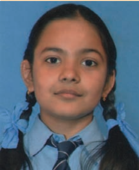
આશી જુગર પરીખ ફોન : ૨૩૨૨૨૧૩૩