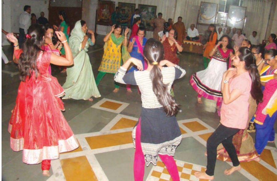
સૌરાષ્ટ્ર-કચ્છ સમાજ સેવા દ્વારા ચૈત્રી નવરાત્રીના ઉપલક્ષમાં સે. ૧૨ બલરામ પરિસર ખાતે તા. ૧૨ને મંગળવારના રોજ ગરબાના કાર્યક્રમનું આયોજન કરવામાં આવ્યું હતું. આ પ્રસંગે સમાજના સભ્યો મોટી સંખ્યામાં ઉપસ્થિત રહ્યા હતા.

ગાંધીનગર, તા. ૧૩ સમાજમાં એકતા જાળવવાઈ રહે તે માટે સમાજ વચ્ચે સંવાદિતા જરૂરી છે. આ સંવાદિતા માટે રમતનો સહારો લેવામાં આવે તો એકતામાં મજબૂતી પણ જાળવાઈ શકે છે, એવા વિચાર સાથે લોકપ્રિય રમત ક્રિકેટના સહારે અમદાવાદ બારશાખ રાજપૂત જ્ઞાતિ પંચના સભ્યો છેલ્લાં ૧૦ વર્ષથી ભેગાં થાય છે. નવી પેઢી અને સમાજના વડીલો પણ આ માધ્યમ માટે એકત્ર થાય છે અને ક્રિકેટ મેચનું આયોજન થાય છે. શરૂઆતથી આ ઉપક્રમમાં ૮ ટીમ ભાગ લઈ રહી છે અને તે મના ૮૮ ખેલાડીઓ ઉપરાંત ખેલાડીઓના કુટુંબીજનો પણ ક્રિકેટના મેદાન સુધી પહોંચે છે અને મુલાકાત દરમ્યાન પ્રેમથી હળીમળીને રહેવાની અને સમાજની નવી પેઢી માટેના વિકાસની વાતો શેર થતી રહે છે. આ ટેનિસ ક્રિકેટ કપ અંતર્ગત મેચ આ વખતે થલેજ નજીકના ગ્રાઉન્ડમાં ચાલી રહી છે. ૩ એપ્રિલથી આરંભાયેલી આ સ્પર્ધા ૨૪ એપ્રિલ સુધી કાયમ રહેશે.