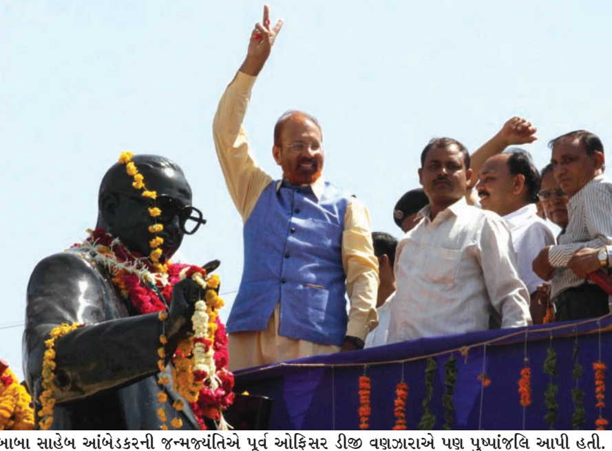
બાબા સાહેબ આંબેડકરની જન્મજયંતિએ પૂર્વ ઓફિસર ડીજી વણજારાએ પણ પુષ્પાંજલિ આપી હતી.