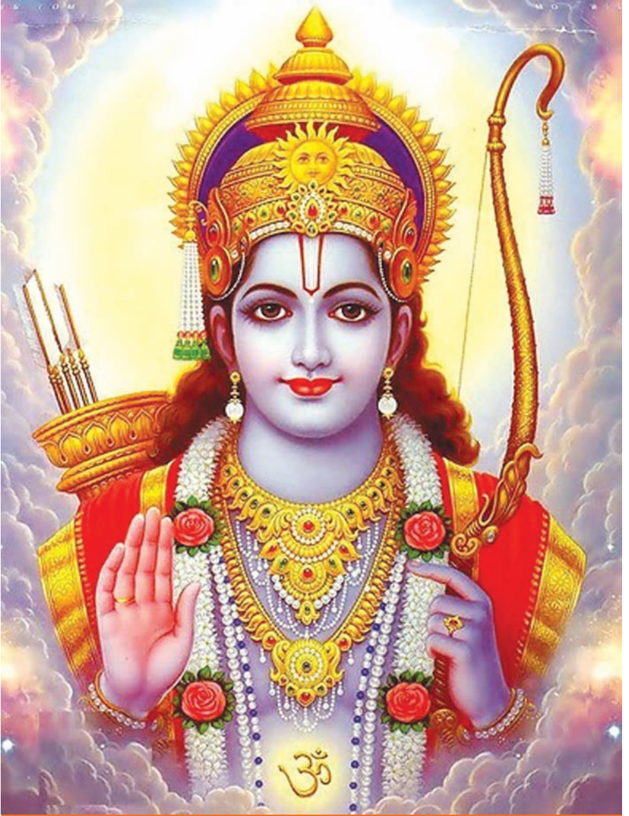
લોકાભિરામમ્ રણરંગદારમ્ રાજુવનેત્રમ્ રઘુવંશનાથમ્ | કારુણ્યરૂપમ્ કરુણાકરમ્ તમ્ શ્રીરામચંદ્રમ્ શરણમ્ પ્રપદ્યે ||