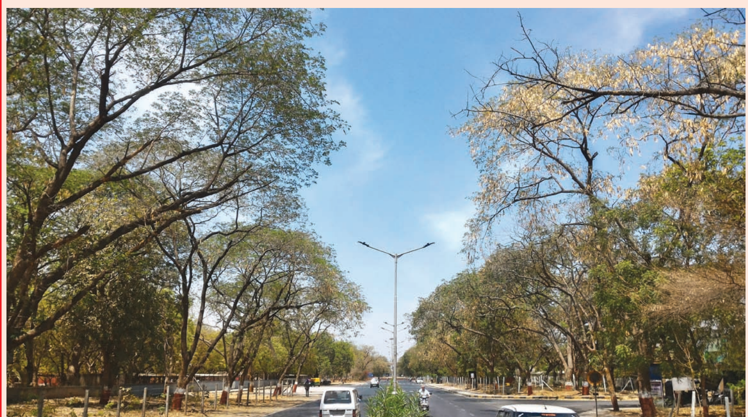
ચાલીસ ડીગી ગરમીમાં પણ તમે જો ગાંધીનગરના એસ.ટી. કેપોથી સેન્ટ ઝેવિયર્સ સ્કૂલવાળા રોડ પર સાંજ પછી લટાર મારવા નીકળો તો તમારા પર કુદરત ખુશભુદાર અમી છાંટણા કરશે...! આ વાક્યમાં કોઈ અતિશયોક્તિ કે કાવ્યતત્વ નથી. વાસ્તવિકતા એ છે કે, આ માર્ગ પર બન્ને બાજુએ શિરીષના વિશાળ વૃક્ષો છે. આ વૃક્ષ પર આ સિંજાનમાં દાઢી કરવાના ઢાશ જેવા સુંવાળા-ભીની સુગંધવાળા ફૂલો આવે અને આ વૃક્ષમાંથી ઝાકડા ઊંચાઈને ફોરોનું વરસતા હોય એવા છાંટણા થાય... એટલે આ વૃક્ષને અંગ્રેજીમાં 'રેઈન ટ્રી' પણ કહે છે. આ વૃક્ષનું અંગ્રેજી બોટાનિકલ નામ અલ્બેગિયા સમન છે. ગાંધીનગરમાં આ એક માર્ગ એવો છે કે જેથી બન્ને તરફ આવા વૃક્ષો છે. ઉનાળામાં ગાંધીનગરના આવા વિશિષ્ટ વૃક્ષોની મઝા માણવાનું રખે ચુકતા...