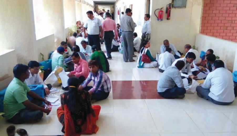
તંત્ર તૈયાર - રવિવારે મતદાન માટે ચૂંટણી તંત્રને શનિવારે તૈયારીને આખરી ઓપ આપ્યો હતો... મતદાન મથક અધિકાર અને સહાયકોને ઈ.વી.એમ. મશીનની સોંપણી અને ચકાસણીનું દર્શન... શનિવારે બપોરથી જ ચૂંટણીના કર્મચારીઓ ઈ.વી.એમ. મશીન લઈને જવાબદારીવાળા મતદાન મથકે પહોંચ્યા હતા...