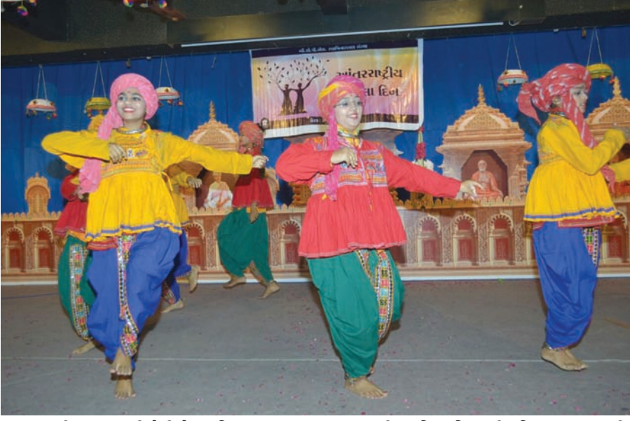
નારી સન્માન-બીએપીએસ મહિલા પોંપ દ્વારા આંતરરાષ્ટ્રીય મહિલા દિવસની પ્રતિક્રમિક ઉજવણી કરાઈ હતી. આ પ્રસંગે યુવતીઓ દ્વારા રાસ-ગરબાની રમઝટ યોજાઈ હતી...