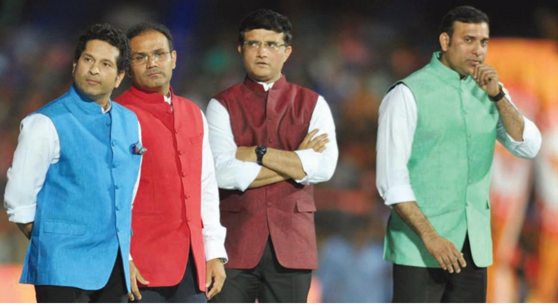
આઈપીએલનો રંગારંગ પ્રારંભ - હૈદરાબાદ ખાતે આઈપીએલ-૨૦૧૭નો બુધવારે મોડીસાંજે રંગારંગ પ્રારંભ થયો હતો... ક્રિકેટ પ્રેમીઓની થિક્કાર હાજરી વચ્ચે આરંભાયેલ આઈપીએલ-૨૦૧૭ની પ્રથમ મેચ પૂર્વે દેશના ટોચના સ્ટાર ચાર ક્રિકેટરોનું લાઈક એચીવમેન્ટ એવોર્ડ સન્માન કરાયું હતું... ક્રિકેટ જગતમાં હંમેશા જેમણે ભારતને ગૌરવ અપાવ્યું છે... સચિન તેંદુલકર, વિરેન્દ્ર સહવાગ, સૌરવ ગાંગુલી અને વીવીએસ લક્ષ્મણના સન્માનથી ક્રિકેટ પ્રેમીઓમાં અને ક્રિકેટના ખેલાડીઓમાં ભારે ઉત્સાહ પ્રગટ્યો હતો...