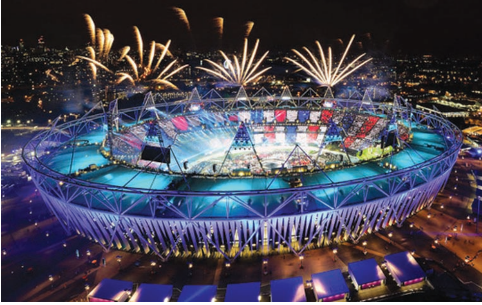
આઈપીએલનો રંગારંગ પ્રારંભ - હૈદરાબાદ ખાતે આઈપીએલ-૨૦૧૭નો બુધવારે મોડીસાંજે રંગારંગ પ્રારંભ થયો હતો... ક્રિકેટ પ્રેમીઓની થિક્કાર હાજરી વચ્ચે આરંભાયેલ આઈપીએલ-૨૦૧૭ની પ્રથમ મેચ પૂર્વે દેશના ટોચના સ્ટાર ચાર ક્રિકેટરોનું લાઈક એચીવમેન્ટ એવોર્ડ સન્માન કરાયું હતું... ક્રિકેટ જગતમાં હંમેશા જેમણે ભારતને ગૌરવ અપાવ્યું છે... સચિન તેંદુલકર, વિરેન્દ્ર સહવાગ, સૌરવ ગાંગુલી અને વીવીએસ લક્ષ્મણના સન્માનથી ક્રિકેટ પ્રેમીઓમાં અને ક્રિકેટના ખેલાડીઓમાં ભારે ઉત્સાહ પ્રગટ્યો હતો...

ઉત્તરપ્રદેશના મુખ્યમંત્રી યોગી આદિત્યનાથે લખનૌની મેડિકલ કોલેજમાં ૫૬ વેન્ટિલેટર મશીનોનું ઉદ્ઘાટન કર્યું હતું. આ અવસરે તેમણે કહ્યું હતું કે યુપીમાં ૬ નવી એઈમ્સ અને ૨૫ નવી મેડિકલ કોલેજ બનાવવામાં આવશે.