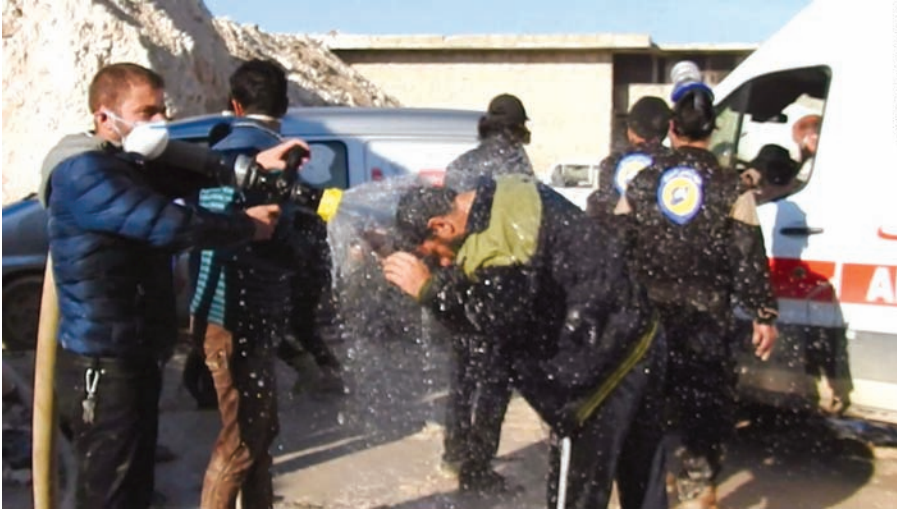
અમેરિકાના પ્રમુખ ડોનાલ્ડ ટ્રમ્પે સિરિયામાં કરવામાં આવેલા રાસાયણિક હુમલાને કઠોર શબ્દોમાં વખોડી કાઢીને આની નિંદા કરી છે. ડોનાલ્ડ ટ્રમ્પે આની નિંદા કરતા કહ્યું છે કે આ પ્રકારના કૃત્ય પૂર્વે ઓબામા વહીવટીતંત્રની ભુલોના પરિણામ તરીકે છે. ટ્રમ્પે નિવેદન જારી કરતા કહ્યું છે કે મહિલાઓ અને બાળકો સહિત નિર્દોષ લોકોની સામે સિરિયામાં જે થયું છે તે વખોડવાપાત્ર છે. સભ્ય દેશો આને નજરઅંદાજ કરી શકે નહીં. તેમણે કહ્યું હતું કે બશર અલ-અસદ શાસનનું આ કૃત્ય છેલ્લા વહીવટીતંત્રની ખામીઓ અને ખચકાટનું પરિણામ છે.

વોશિંગ્ટન, તા. ૫ આંતંકવાદીઓના શસ્ત્ર ભંડારને હિંસાચરન સિરિયાના ત્રાસવાદીગ્રસ્ત વિસ્તારમાં કેમિકલ હુમલો કરવામાં આવતા વિશ્વભરમાં ખળભળાટ મચી ગયો છે. આ હુમલો કરનારના સંદર્ભમાં નક્કર માહિતી મળી નથી પરંતુ રશિયા તરફ શંકાની સોય રહેલી છે. આ હુમલાના કારણે મોટી સંખ્યામાં લોકોના મોત થયા છે. રશિયન સંરક્ષણ મંત્રાલય દ્વારા જણાવવામાં આવ્યું છે કે સિરિયાન હવાઈ હુમલો ખાનશેફોનના પૂર્વીય પારા વિસ્તારમાં કરવામાં આવ્યો હતો.