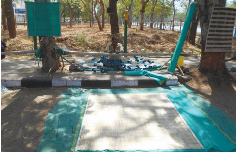
વાંસની ચઢાઈનો ગૃહ ઉદ્યોગ હજુ જીવંત છે. કારીગરો પોતાના હુસ્તરથી સારી આજીવિકા પણ મેળવી રહ્યા છે. અદ્યતન પડદા વચ્ચે પણ ક્યાંક બારી-બારણા માટે ગરમીથી બચવા આ ચઢાઈ ઘણી રાહત આપતી પુરવાર થાય છે. પરંતુ બદલાતા સમયનાં વહેણમાં હવે આવી કલાઓ ધીરે ધીરે લુપ્ત થઈ રહી છે.