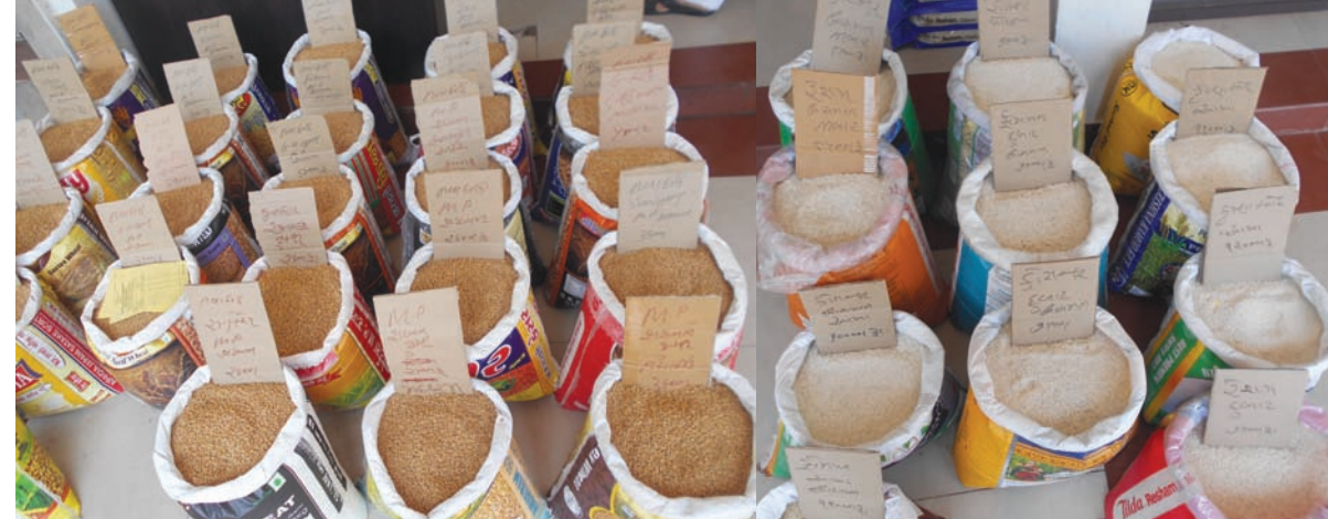
આજ કાલ ગુણિણીઓ માટે વર્ષભર માટે ઘઉં-ચોખા, મસાલા ભરવાની સિઝન ચાલી રહી છે. બજારમાં તૈયાર 'આટા' પ્રાપ્ત હોવા છતાં હજી પણ ઘઉંની પસંદગી કરવી સાફ કરી દિવેલથી મોઈને વર્ષભર સાચવી વપરાશમાં લેવાની પરંપરા જળવાઈ છે. જો કે હવે તો સાફ કરી દિવેલથી મોએલા ઘઉં તૈયાર મળે છે. જે નોકરી કરતી મહિલાઓ માટે આશીર્વાદરૂપ છે.

ગાંધીનગર, તા.૬ આજે ગાંધીનગરના સે-૧ પમાં સરકારી વિનયન કોલેજ ખાતે વાર્ષિક ઈનામ વિતરણ સમારોહ યોજાયો હતો. જેમાં કોલેજમાં વર્ષ દરમિયાન યોજાયેલ પ્રવૃત્તિઓ જેવી કે રમતગમત, સાંસ્કૃતિક, યુથ ફેસ્ટિવલ, સ્વયં શિક્ષણ દિવસ, એનસીસી, એનએસએસ, સીડબલ્યુડીસી તથા રાજયકક્ષાની નિબંધ સ્પર્ધા વગેરેમાં વિજેતા થયેલા વિદ્યાર્થીઓને ઈનામો આપી નવાજવામાં આવ્યા હતા. ઈનામો સાથે આ વિદ્યાર્થીઓને પ્રમાણપત્રો પણ આપી પ્રોત્સાહિત કરાયા હતા. આ પ્રસંગે કોલેજના આચાર્ય ડૉ. કે. કે. વૈષ્ણવે વિદ્યાર્થીઓને કારકિર્દી ઘડતર માટે આ પ્રકારની પ્રવૃત્તિઓ મદદરૂપ બનતી હોવાનું જણાવ્યું હતું. કાર્યક્રમમાં કોલેજનો સમગ્ર સ્ટાફ તથા મોટી સંખ્યામાં વિદ્યાર્થીઓ ઉપસ્થિત રહ્યા હતાં.