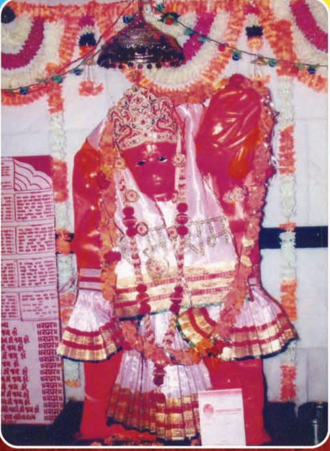
બાલા હનુમાનજી મહારાજ રામમઢી, જુનામાંકા, તા. હારીજ, જી.પાટણ