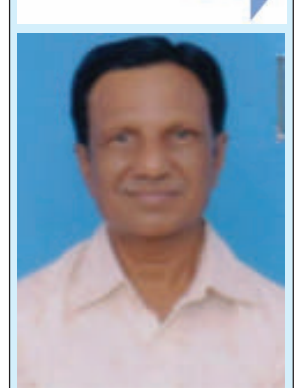
હસમુખ મેકવાન અભિનેતા, નાટ્યકાર

ગાંધીનગર ગમે ન માત્ર સુઆયોજન, કુદરતી-માનવસર્જિત સુંદરતા માટે પરંતુ મજાના લોકો અને મજાની જિંદગી માટેય ગાંધીનગર શહેર ખૂબ ગમે છે. નગરજનો જિંદગીને ભરપૂર જીવતા અને માનવ શબ્દના અર્થને સાકાર કરતા કલા, સંસ્કૃતિ ને સેવાપ્રેમી નગરજનો અહીં વસે છે. પ્રવૃત્તિ, સંસ્થા ગમે સાંસ્કૃતિક અને સેવા પ્રવૃત્તિ કરતી અનેક સંસ્થાઓ ગમે છે. જુનિયર સિટિઝન કાઉન્સિલ, સિનિયર સિટિઝન કાઉન્સિલ, આત્મન ફાઉન્ડેશન, ગાંધીનગર કલ્ચરલ ફોરમ, જીઈ કલબ અને કેંથોલિક ચર્ચની અનેક વિવિધ પ્રવૃત્તિઓ ખૂબ ગમે છે. નગરને બહેતર બનાવવા જાહેર સ્વચ્છતા બાબતે અને દિન-પ્રતિદિન વધી રહેલી રૂંપડપટ્ટી માટે નક્કર પ્રયાસો હાથ ધરાય તે જરૂરી લાગે છે. નગર માટે હું કરી શકું સાંસ્કૃતિક વારસાના જતન માટે પ્રયાસરત છું અને રહીશ.