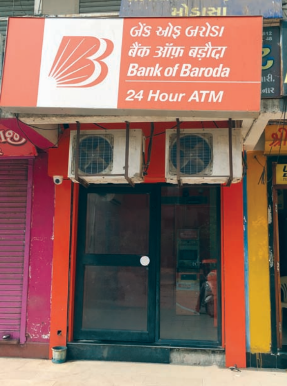
દેશભરમાં નોટબંધીના કારણે કાળુ નાણુ બહાર આવવાની વાત તો દૂર ફંફા પડી રહ્યા છે. નોટબંધીને પાંચ મહિના થવા આચ્યા છા અરવલ્લી

મોડાસા, તા. ૨૩ રહી લોકોને તેમના હકના ધોળા અરવલ્લી જિલ્લા સહિત નાણા પછ મેળવવામાં રીતસરના