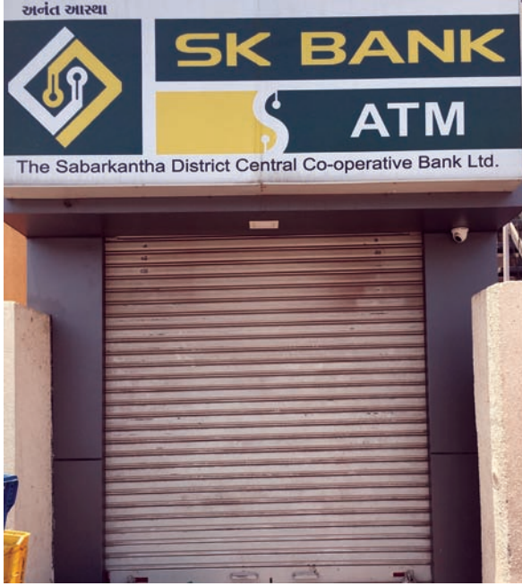
રહ્યો છે. સાબરકાંઠા ડિસ્ટ્રીક્ટ સેન્ટ્રલ કો ઓપરેટીવ બેંકના એટીએમ મશીનના શટર અહવાડીયાથી બંધ રહેતા ગ્રામ્ય વિસ્તારોમાં મહત્તમ પશુપાલકોના દૂધના પગાર આ બેંક એકાઉન્ટમાં થતા હોવાથી

જ ન હોઈ એટીએમ કાર્ડ ધારકોને હાલાકીનો સામનો કરવો પડી સામનો કરવો પડી રહ્યો છે. મોડાસા ચાર રસ્તા પર આવેલ ધી