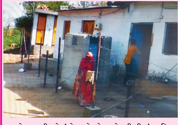
મકાનો પણ બની ગયેલાં છે. ત્યારે હવે જી.એમ.ડી.સી નાં સ્થાનિક મેનેજમેન્ટ નાં લોકો દ્વારા બ્રહ્મપુરી વિસ્તાર માં રહેતાં લોકો નાં રહેણાંક વાળા મકાન નાં દરવાજા આગળ જ ફેન્સીંગ કાટા વાળી વાડ કરી દઈ મોટી હેરાનગતી ઉભી કરી છે.

અંબાજી નાં બ્રહ્મપુરી વિસ્તાર જે મહત્તમ જી.એમ.ડી.સી વિસ્તાર તરફ નો ભાગ માનવામાં આવે છે. જ્યાં વર્ષો થી રહેણાંક નાં