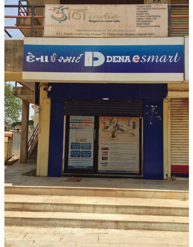
સામે ઉદ્ધતાઈપૂર્વક વર્તન કરતા હોવાનુ અને એટીએમ મશીનો પરખાવી દેવામાં આવતા ગ્રાહકોમાં ઉગ્ર રોષે ફેલાયો છે.

સામાન્ય ભૂલ હોય તો પણ જિલ્લાના બેંક અધિકારીઓ તેમની પાલી હોવાનુ જણાવતા સીધા સરકારને રજૂઆત કરવાનુ રોકકુ