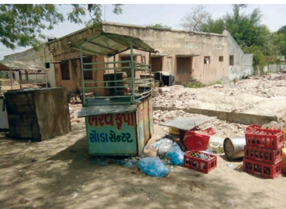
લાવી વધુ તપાસ હાથ ધરી છે. આમ શિહોરી પાટણ રોડ ઉપર સોડા- અને પોલીસે આરોપીને પકડવા ચક્રો ગતિમાન કર્યાં છે.

પ્રાત વિગતો અનુસાર કાંકરેજ તાલુકાના મુખ્ય મથક શિહોરીમાં પાટણ નાળાથી થોડા અગળ સોડાની બે લારીઓ ઉપર એએસપી અક્ષયરાજ મકવાણાએ રેડ કરી હતી. જેમાં સોડાના ધંધાની આડમાં દારૂનો દંધો કરતા હોવાની શંકાના આધારે પોલીસે રેડ કરતા વિદેશી દારૂની બોટલો, બીયર તેમજ ઠંડા પીણાના કેરેટ તેમજ ઠંડા પાણીની બોટલ અને પાણીના પાઉચ મળી આવ્યા હતા. જો કે આ ઠંડા પીણાની આડમાં વિદેશી દારૂનો ધંધો કરતા બુટલેગરો સામે શિહોરી પોએસઆઈ એચ.કે. મકવાણા અને પોલીસ સ્ટાફ સાથે એએસપી મકવાણાએ રેડ કરી તમામ જગ્યાએ તપાસ કરતા ૮ નંગ બીયર ટીન ટિનુભા ડાભીની લારીમાંથી અને ૧૧ નાની બોટલ