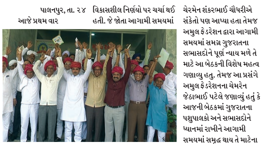
ફેડરેશનના ૧૮ સભ્યોએ એક મંચ પર બનાસકાંઠાની બનાસડેરી પર ભેગા થયા હતા. આ બેઠકમાં અનેકો નવીન બનાસ ડેરી પ્લાન્ટ સ્થાપશે. આ બેઠકમાં અનેકો નવીન નવીન પ્લાન્ટ બાબતે બનાસડેરી

વારાણસીમાં નવીન બનાસ ડેરી પ્લાન્ટ સ્થાપશે