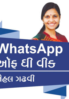
WhatsApp ઓફ ઈ વીડ નેહલ ગઢવી

કેળવવો છે. પુસ્તકોની યાદી માંગું છું." આ મિત્ર હું સૂચવું તે વાંચશે? અભ્યાસનિષ્ઠ બનશે? વાતપુસ્તકથી વાચનરસ કેળવી શકાશે નહીં. રસેન્દ્રિયને તેજસ્વી તેમ જ તંદુરસ્ત બનાવ્યા વગર લેવાતો વાર્તાસ્ત્ર જ્ઞાનની હોજરીને બગાડે છે.