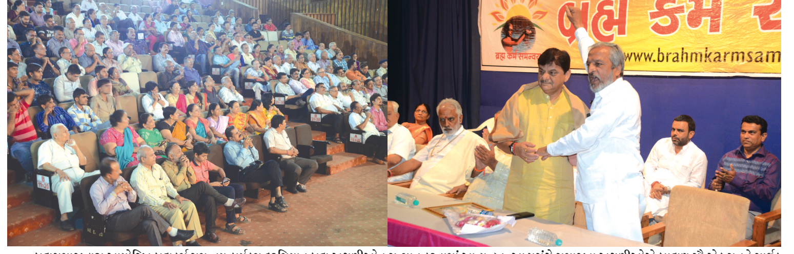
બ્રહ્મસમાજ દ્વારા આયોજિત બ્રહ્મકર્મ સમન્વય કાર્યક્રમ દરમિયાન બ્રહ્મ અગ્રણીઓનું સન્માન કરવામાં આવ્યું હતું. આ પ્રસંગે સમાજના અગ્રણીઓએ બ્રાહ્મણ સૌ એક સુત્રને સાથે કરવાના પ્રયાસરૂપે બ્રાહ્મણ માટે બ્રાહ્મણ બનવાના અભિગમ સાથે સમાજની એકતાને વધુ મજબૂત કરવા હાકલ કરી હતી.

રાજનીતી સ્વતંત્રતા પ્રાપ્ત થઈ તે યાત્રાનો એક પગલા છે. તેવું કહી રાજ્યપાલશ્રીએ ગાંધીજીના સ્વતંત્રતા સ્વરાજ વચ્ચેની પાતળી ભેદ રેખાની દૃષ્ટાંત પૂર્વક વાત કરી હતી. રાજનીતીમાંથી ધર્મ અને નીતી કાઢી નાખવામાં આવશે તો આજનું રાજકરણ જોવા મળશે. જેથી રાજનીતીને ધર્મ આધારિત અને નીતી આધારિત બનાવું પડશે. સ્વરાજ લાવવા માટે યુવાનાએ શું કરવું પડશે, તેની વાત કરીને રાજ્યપાલશ્રીએ જણાવ્યું હતું કે, ગાંધીજીએ હિંદ સ્વરાજ પુસ્તકમાં