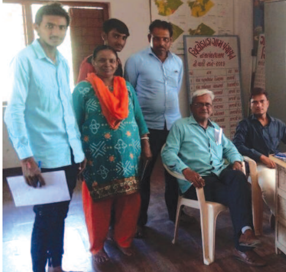
ચિલોડા ખાતે પાનકાર્ડ કેમ્પ યોજાયો