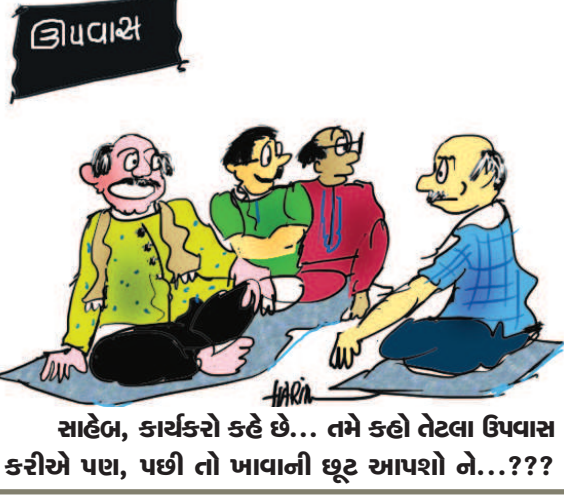
સાહેબ, કાર્યકરો કહે છે... તમે કહો તેટલા ઉપવાસ કરીએ પણ, પછી તો ખાવાની છૂટ આપશો ને...???