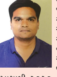
“ભારતમાં હવે સ્પોર્ટ્સ પ્રત્યેનો દષ્ટિકોણ બદલાયું છે તેમજ સ્પોર્ટ્સ પ્રત્યે જાગૃતિ પણ વધી છે. બીજું સરકારનો સ્પોર્ટ્સ ક્ષેત્રે અભિગમ પણ બદલાતા વધુ સહયોગ પ્રાપ્ત થઈ રહ્યો છે. વળી, આંતરરાષ્ટ્રીય કક્ષાની સ્પોર્ટ્સ ટૂર્નામેન્ટમાં આપણી ભાગીદારી વધી છે. સરકારે આગામી ૨૦૨૦, ૨૦૨૪ અને ૨૦૨૮ના ઓલિમ્પિક માટે ટાસ્ક ફોર્સ કમિટી બનાવી છે જે ચોક્કસ વધુ સારા પરિણામ આપશે.”

કોમનવેલ્થ ગેમ્સમાં ભારતનું પ્રદર્શન અત્યંત ઉત્કૃષ્ટ રહેતા સમગ્ર દેશમાં ખુશીની લહેર પ્રસરવા પામી છે, પહેલીવાર આંતરરાષ્ટ્રીય કક્ષાના રમતોત્સવમાં ભારતે આટલા મેડલ્સ જીત્યાં હોય તેવી ઘટના બની છે. ભારતના મેડલ્સની સંખ્યા ૨૫ ઉપર પહોંચી જવા પામી છે અને હજુ તે વધશે તેવું સ્પષ્ટ જણાઈ રહ્યું છે. અત્યાર સુધી એશિયન ગેમ્સ હોય કે ઓલિમ્પિક આપણે નબળા પ્રદર્શનને કારણે મહેલાટોણાનો ભોગ બનતા રહ્યાં છીએ પરંતુ હવે સ્પોર્ટ્સ પ્રેમી ભારત સશક્ત રાષ્ટ્ર બનીને ઉભરવા થનગની રહ્યું છે તેવો આશાવાદ કોમનવેલ્થ ગેમ્સના પ્રદર્શન થકી જણાઈ રહ્યો છે. વળી, આ પ્રદર્શનમાં મહિલા ખેલાડીઓનો ફાળો નોંધપાત્ર જ નહીં પરંતુ તેમના મેડલ્સની સંખ્યા પણ વધુ છે ત્યારે ગાંધીનગરમાં સ્પોર્ટ્સ ક્ષેત્રે સંકળાયેલા નાગરિકો ભારતના આ પરફોર્મન્સને શી રીતે મૂલવે છે તે જાણવા ગાંધીનગર સમાચાર પ્રયાસ કર્યો હતો. “ભારત સરકાર અને ગુજરાત સરકારની સ્પોર્ટ્સ પ્રત્યે બદલાયેલી નીતિના કારણે આપણે સેન્ટર ફોર એક્સેલન્સ, સ્પોર્ટ્સ એકેડેમી તેમજ રાજ્યમાં શક્તિદ્રૂત યોજના વગેરેનો પ્રારંભ કર્યો છે. જેના કારણે ખેલાડીઓને આંતરરાષ્ટ્રીય કક્ષાના ક્ષેત્ર પાસે પહોંચવાની તથા વૈજ્ઞાનિક ઢબની તાલીમ મળી રહી છે. સ્વર્ણમ સ્પોર્ટ્સ યુનિવર્સિટી દ્વારા ખેલાડીઓના ડીએનએ પ્રોફાઇલ તૈયાર કરી તેના આધારે ડાયેટ અને એક્સરસાઈઝ સૂચવવામાં આવ્યાં છે. આ કારણે ખેલાડીઓના પ્રદર્શનમાં ગજબનાક પરિવર્તન આવ્યું છે.”