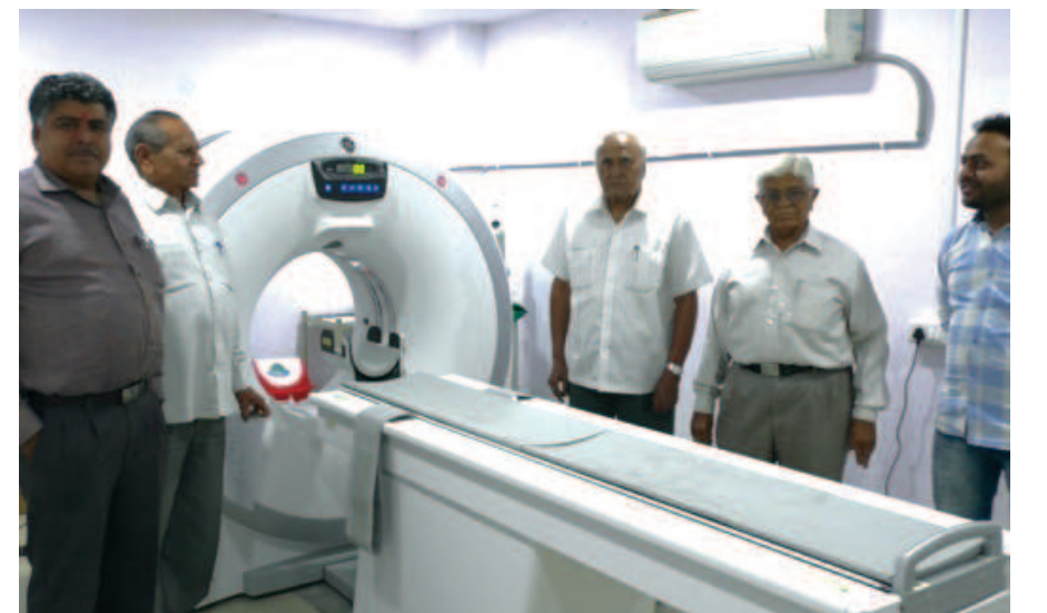
વાત્રક જનરલ હોસ્પિટલમાં સી.ટી.સ્કેનની સુવિધા માટે આધુનિક મશીન વસાવાવું