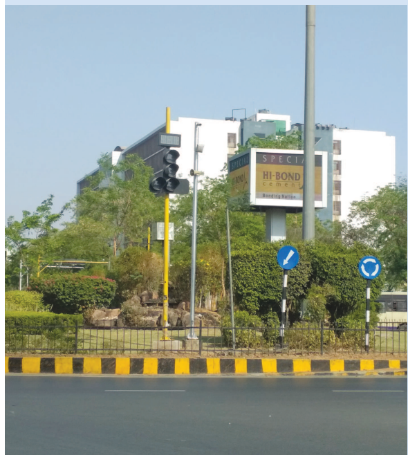
છે. જો કે આ ટ્રાફિક સિગ્નલની અનિયમિતતાથી વાહનચાલકો અવઢવ અનુભવી રહ્યા છે. શહેરના કેટલાક સ્થળોએ કોઈ પણ સુચન વગર ટ્રાફિક સિગ્નલ આખો દિવસ બંધ રહે છે તો કોઈકવાર

ગાંધીનગર, તા. ૬ ગાંધીનગર શહેરમાં વાહનોની સંખ્યામાં થયેલા વધારાને ધ્યાને લઈ તંત્ર એ મુખ્યમાર્ગ ઉપરના સર્કલ ટ્રાફિક સિગ્નલ તૈનાત કર્યા