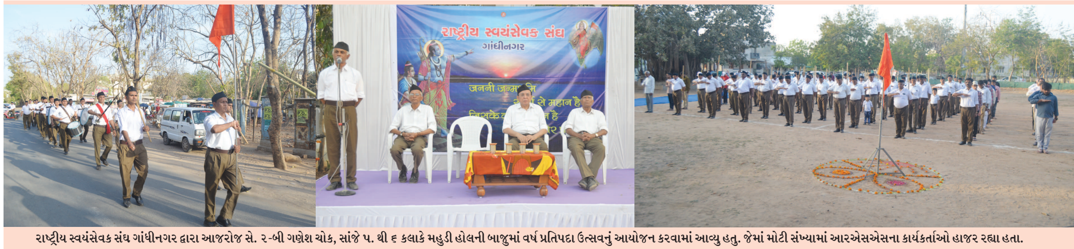
રાષ્ટ્રીય સ્વયંસેવક સંઘ ગાંધીનગર દ્વારા આજરોજ સે. ૨-બી ગણેશ ચોક, સાંજે ૫. થી ૬ કલાકે મહુડી હોલની બાજુમાં વર્ષ પ્રતિપદા ઉત્સવનું આયોજન કરવામાં આવ્યું હતું. જેમાં મોટી સંખ્યામાં આરએસએસના કાર્યકર્તાઓ હાજર રહ્યા હતા.