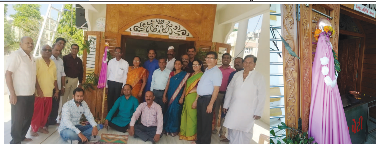
મહારાષ્ટ્ર સમાજ સેક્ટર-૨ ૧, ગાંધીનગર ખાતે આજ હિન્દુ નૂતન વર્ષ નિમિત્તે ગુડી પડવાની ઉજવણી કરવામાં આવી હતી. જેમાં સમાજના સર્વ મરાઠી બંધુઓએ કાર્યક્રમમાં હાજર રહી હર્ષોલ્લાસથી ઉજવણી કરી નવા વર્ષનું સ્વગત કર્યું હતું.