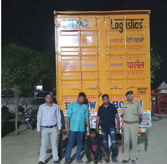
કરી ઝડપી પાડ્યું હતું. પોલીસે કન્ટેનરમાં ચેક કરતા ફેવીકોલના ડ્રમની આડમાં વિદેશી દારુની કુલ ૬૨૫ પેટીમાં બોટલ નંગ-૭૫૦૦ કિ. રૂ. ૩૦,૦૦,૦૦૦ તથા કન્ટેનર નં

સમયે અમદાવાદ તરફથી આવી રહેલા કન્ટેનરને ઉભા રહેવા માટે ઈશારો કર્યો હતો. પરંતુ તેના ચાલકે કન્ટેનર ઉભુ રાખ્યું નહતું. જેથી પોલીસને શંકા જતા પીછો કરી હોટલ પુરોહિત પાસે આડશ