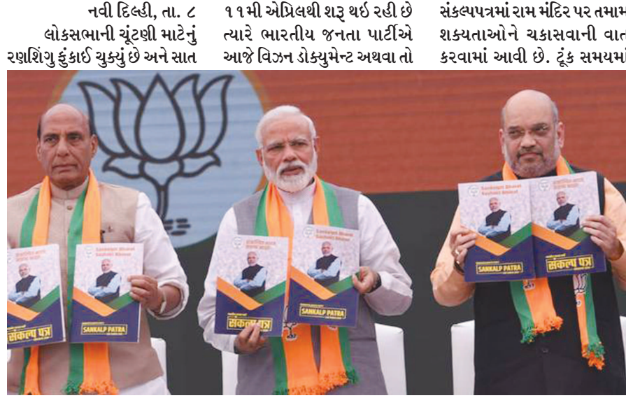
તબક્કામાં યોજનારી લોકસભાની ચૂંટણી માટે મતદાનની પ્રક્રિયા સંકલ્પપત્રમાં શ્રેણીબદ્ધ વચનો આપવામાં આવ્યા છે. જ શાંતિપૂર્ણ માહોલમાં મંદિરના નિર્માણ માટે પ્રયાસ કરવાની વાત

કરવામાં આવી છે. જમ્મુ કાશ્મીરમાંથી કલમ ૩૫૬ને દૂર કરવાના પ્રયાસ પણ કરવામાં આવશે. યુનિકોર્મ સિવિલ કોડને લાગુ કરવામાં આવશે. તમામ ખેડૂતોને છ હજાર રૂપિયાનો લાભ મળશે. નાના અને સિમાંત ખેડૂતોને ૬૦ વર્ષના ગાળા બાદ પેન્શનની સુવિધા આપવામાં આવશે. દેશના નાના દુકાનદારોને ૬૦ વર્ષ બાદ પેન્શનની સુવિધા આપવામાં આવશે. દરેક પરિવાર માટે પાકા મકાનની ખાતરી કરવામાં આવશે. વધુમાં વધુ ગ્રામીણ પરિવારોને ગેસ સિલિન્ડર આપવાના પ્રયાસ કરવામાં આવશે. આયુષ્યમાન ભારત હેઠળ ૧.૫ લાખ હેલ્થ અને વેરનેસ સેન્ટર ખોલવામાં આવશે. સિટિઝનશીપ સુધારા બિલને