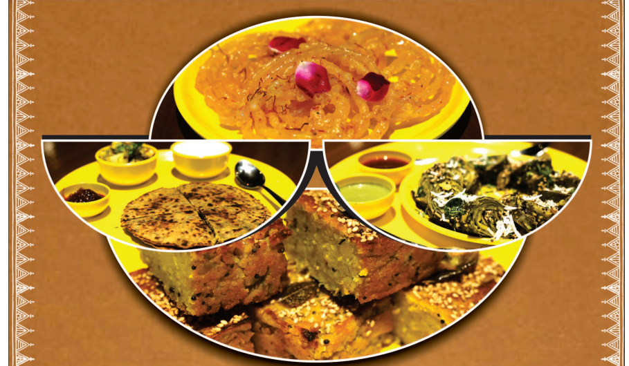
ગાંધીનગરનાં સરસવતી નગરમાં શાંત અને સ્મરણીય વાતાવરણ સાથે ગુજરાતના પારંપારિક સંસ્કૃતિનાં ઝાંખું કરાવતું વિવિધ ગુજરાતી ભોજન - વ્યંગજાના સ્વસ્થાળનું જાહલ એટલે...

લંડન, તા. ૮ ફરાર શરાબ કારોબારી વિજય માલ્યાને ભારત લાવવાની આશા ઉજ્જવળ બની છે. લંડન કોર્ટે પ્રત્યાર્પણની સામે માલ્યાની અરજીને ફગાવી દીધી છે. હકીકતમાં પ્રત્યાર્પણની સામે અરજી દાખલ કરીને માલ્યાએ પોતાને બચાવવાના વધુ પ્રયાસો કર્યા હતા પરંતુ કોર્ટે વિજય માલ્યાને જોરદાર ઝટકો આપી દીધો છે. આ પહેલા બ્રિટનના હોમ સેક્રેટરી સાજિદ જાવેદે માલ્યાના પ્રત્યાર્પણ પર હસ્તાક્ષર કરી દીધા હતા. યુકે સરકારના આ