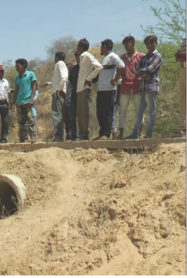
ત્રણ કિલોમીટર પડાવ પાર કરી લાકરોડાની કોતરોમાં પગલાં ઉપરથી હાલ તો દીપડો

પોચડાથી લાકરોડા તરફ પહોંચ્યો હોય તેવું તેના પગલાંઓ ઉપરથી અંદાજ લગાવી શકાય છે ત્યારે ગ્રામમાં રહેતા પશુ માલિકોમાં પણ રાત્રી દરમિયાન પોતાના પશુઓની સુરક્ષાને લઈને ડર પેદા થયો છે. હાલ તો ગામમાં ભયનો માહોલ છે ને અમથયુએ કોઈએ ભુમ પાડી કે હે દિપડો આવ્યો તો ભલભલાના છકા છુટી જાય છે. ત્યારે હાલ તો વનઅધિકારીઓ દ્વારા દીપડાને પાંજરે પુરવા હાલ તો નવી ટીમ અજમાવવામાં આવે છે ત્યારે હાલ તો ચાર દિવસ બાદ પણ દીપડો પાંજરે ના પુરાતા ગ્રામજનો સહિત આજુબાજુના લોકોમાં ભયનો માહોલ છે.