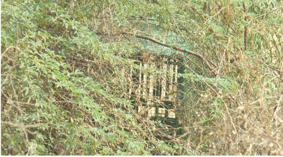
ઉપર દોડી આવ્યા હતાં અને દીપડાને પાંજરે પુરવા સાબરમતી કોતર પાસે અગલ-