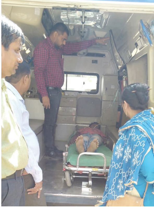
સિઝનનો પ્રથમ તબક્કો ચાલી પ્રજાજનો આકુળ-વ્યાકુળ થઈ રહ્યો છે તેવામાં શરૂઆતથી જ જવા પામ્યા છે. ત્યારે ગરમીના ગરમીનો પારો ઠંડો થી ઠર ડિઝી કારણે વિવિધ જાતની બીમારીઓ

સાથે આકસ્મિક દર્દીઓનો વધારો થતા ૧૦૮ ઈમર્જન્સી એમ્બ્યુલન્સની કામગીરીમાં વધારો થઈ જવા પામ્યો છે. મોડાસા સહીત અરવલ્લી જિલ્લામાં સમાહથી ગગનમાંથી આગના ગોળા વરસતા લોકો ત્રાહિમા મ પોકારી ઉઠ્યા છે. અસહ્ય ગરમીના પગલે હાઈપર ટેન્શન, છાતીમાં દુખાવાના, સામાન્ય દુખાવાના, ગભરામણ થવાના, છાતીમાં દુખાવો ઉપાડવો, ડિહાઈડ્રેશન ના ૧૦૮ એમ્બ્યુલન્સમાં ૨૬ ઈમર્જન્સી કોલ આવતા સ્થળ પર પહોંચી સારવાર આપવાની ફરજ પડી હતી. મોડાસા નજીક અમલાઈ પ્રાથમિક શાળામાં ગુરુવારે ચાલુ પરીક્ષાએ ધો-૮નો વિદ્યાર્થી ઢળી પડતા ૧૦૮ એમ્બ્યુલન્સની ટીમે શાળામાં પહોંચી બાળકને સ્થળ પર પહોંચી સારવાર આપી હતી. ઉનાળામાં ગરમી અને લુધી બચવા સતત પાણી પીવાની અને વધુ માત્રામાં પ્રવાહી પર નિર્ભર રહેવા અને બપોરના સમયે ઘરની બહાર નહિ નીકળવાની સલાહ નિષ્ણાત તબીબો દ્વારા પ્રજાજનોને આગ્રહ કર્યો છે.