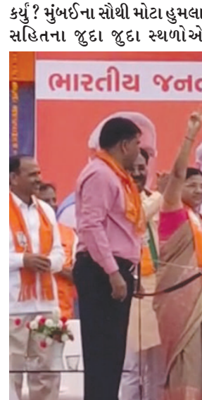
થયેલા આતંકવાદી હુમલામાં ત્રણ ત્રણ દિવસ આતંકવાદીઓએ મુખ્યમંત્રીએ કહ્યું કે સેનાને જ્યારે સર્જીકલ સ્ટ્રાઈક કરી દેશના બે ભાગલા પડ્યા હતાં. એ સમયે દેશનું સુકાન સરદાર

વડાપ્રધાન બનશે તો દેશને લુંટનારાઓને નહિ છોડે અને એના ભયથી જ ચોરીદારને વડાપ્રધાન બનતા રોકવા બધા ભેગા મળ્યા છે. મુખ્યમંત્રી રૂપાણીએ વધુમાં કોંગ્રેસને આડે હાથ લેતા જણાવ્યું કે મોદી કહે છે ભષ્ટાચાર હટાવો, ગરીબી હટાવો તો આ લોકો મોદી હટાવવા નીકળ્યા છે. દેશના હિત માટે કામ કરનાર મોદી અને રાષ્ટ્રવાદ એક તરફ છે તો બીજા તરફ પરિવારવાદ છે. પરિવારવાદમાં ખુબેલી કોંગ્રેસ પાસે દેશ હિતના કોઈ મુદ્દા જ નથી દેશના હિતને જોખમ પેરિવારવાદ હિત સિવાય બીજું કંઈ નથી. એક બાજુ સર્વ ધર્મ સમભાવનું હિત જોનાર છે અને ગરીબો, કોઈપણ ધર્મ માટે સર્વને સમાન હક્ક આપનાર છે. સોનિયાના ઈશારે દસ વર્ષ કોંગ્રેસની સરકાર ચાલી ત્યારે શું