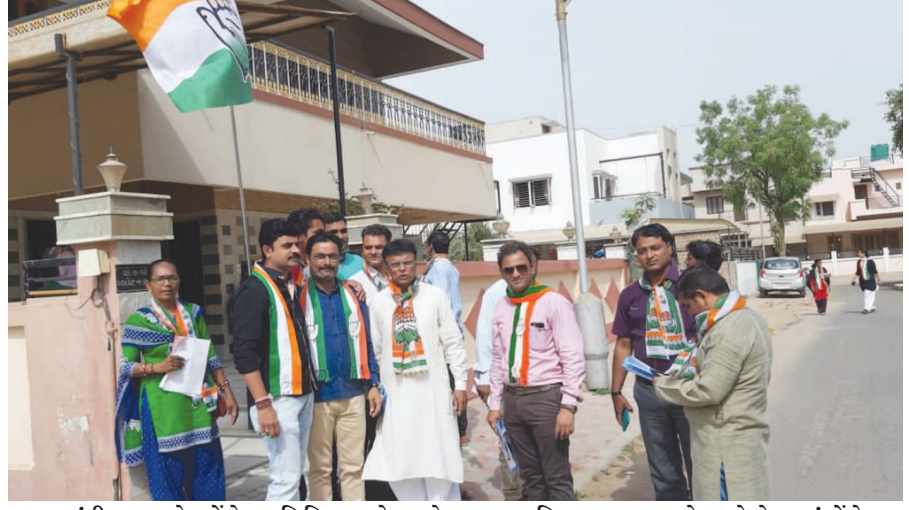
ગાંધીનગર શહેર કોંગ્રેસ સમિતિ દ્વારા ડોર ટુ ડોર પ્રચાર અભિયાનના ભાગરૂપે આજે સે. ૬માં કોંગ્રેસના કાર્યકરોએ ફેરણી કરી હતી અને કોંગ્રેસના ઉમેદવારનો પરિચય આપતી તેમજ કોંગ્રેસના ચૂંટણી વચનો દર્શાવતી પત્રિકાનું વિતરણ કર્યું હતું.

ઈલેક્ટ્રીક રૂમ અને લીફ્ટમાં પાણી કચાંથી આવે છે, તે ફોલ્ટ શોધવા માટે દોડધામ શરુ કરાઈ ગાંધીનગર, તા. ૧૬ પાટનગરની મેડીકલ કોલેજ સંચાલિત ૬૦૦ બેડની ઈમારતમાં ગ્રાઉન્ડ ફ્લોર પર આવેલા ઈલેક્ટ્રીક રૂમ અને લીફ્ટમાં પાણી ભરાઈ જવાના કિસ્સાને પગલે આજે વિજપુરવઠો બંધ કરવામાં આવ્યો હતો. પાણી ભરાઈ રહેવાના કારણથી ઉકેલને પગલે એક સાર્ડિનો વીજપુરવઠો બંધ કરવામાં આવતા આજે સવારથી દર્દીઓ - મુલાકાતીઓ સહિત સ્ટાફના કર્મચારીઓ પણ હેરાન પરેશાન થઈ ગયા હતા. જ્યારે તમામ લીફ્ટ અને ઈલેક્ટ્રીક રૂમમાંથી પાણી નીકળી દેવામાં આવ્યું છે અને પાણી કચાંથી આવે છે તે શોધવા માટે પીઆઈયુની ટીમ સવારથી કામે લાગી ગઈ હતી અને દોડધામ શરુ કરી દીધી હતી જો કે તેમનું કહેવું છે કે ફોલ્ટ મળી ગયો છે અને ગણતરીના કલાકોમાં તેને રીપેરીંગ કરી દેવામાં આવશે. જ્યારે બપોરના સમય બાદ થોડાક સમય કરવામાં આવી હતી. જ્યારે સિવિલ હોસ્પિટલમાં એક સાર્ડિનો વિજપુરવઠો બંધ કરવામાં આવતા અંદાજીત ૨૦૦ જેટલા દર્દીઓને હેરાનગતિનો સામનો કરવો પડ્યો હતો. દર્દીઓને લઈને એકસ-રે, સોનોગ્રાફી માટે લઈ જવામાં સ્ટાફના કર્મચારીઓની હાલત ખરાબ થઈ ગઈ હતી. જ્યારે ડાયટના ડબ્બા લઈને જતા કર્મચારીઓની હાલત કફોડી બની ગઈ હતી. જ્યારે બ્લડબેંકમાં બ્લડ સેમ્પલ આપવા માટે જતા સ્નેહીજનો પણ સીડીના ચઢાવ-ઉતારથી થાકી ગયા હતા. જ્યારે દર્દીઓ માટે વારંવાર નીચે આવતા જતા સગાઓની સંખ્યા ખુબ જ ઓછી જોવા મળી હતી. તો બીજી તરફ સિવિલ તંત્ર દ્વારા નવી બિલ્ડીંગની નીચે દર્દીઓ હેરાન ન થાય તે માટે બ્લિલ ચેર સાથે કર્મચારીઓ ઉભા કરી દેવામાં આવ્યા હતા. જ્યારે બપોર બાદ લિક્વટ પણ કાર્યરત કરી દેવામાં આવી હતી. ત્યારે આજે વિજપુરવઠો બંધ રહેતા દર્દી, સગાઓ સહિત સ્ટાફના માણસોની હાલત પણ કફોડી બની જવા પામી હતી.