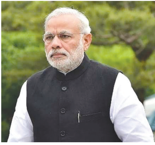
માટે જાહેરસભા થનાર છે. પ્રથમ દિવસે ત્રણ જાહેર સભા વાગે તેમની સભા થશે જ્યારે ૩.૩૦ વાગે સોમનાથ મંદિરે

વિશ્વમાં લોકપ્રિયતા મેળવી રહેલા મોદી દેશના પુનઃ વડાપ્રધાન બનાવવા મતદારોમાં પણ ઉત્સાહ દેખાઈ રહ્યો છે. આવતીકાલે ૧૭મીએ ત્રણ જાહેરસભા કરનાર છે જે પૈકી એક વાગે હિંમતનગરમાં જાહેરસભા યોજનાર છે જ્યારે બપોરે ત્રણ વાગે સુરેન્દ્રનગર લોકસભા બેઠક હેઠળ પોલીસ પરેડ ગ્રાઉન્ડ ખાતે સભા યોજાશે જ્યારે સાંજે વાગે આણંદ લોકસભા બેઠક હેઠળ