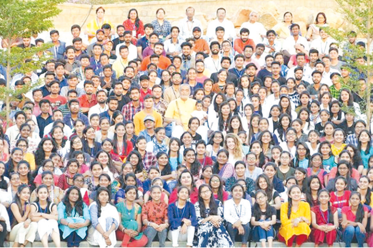
કડી સર્વ વિશ્વવિદ્યાલય દ્વારા સંચાલિત વીપીએમપી પોલીટેકનીક, કામંસી, ફીઝીયોથેરાપી, એમબીએ વગેરે કોલેજના ૧૫૫ જેટલા વિદ્યાર્થીઓએ હૈદરાબાદ સ્થિત કલાશાંતી વનમાં યોજાયેલી સાત દિવસીય ઓલ ઈન્ડિયા યુથ સેમિનારમાં ભાગ લીધો હતો. સેમિનાર અંતર્ગત વિદ્યાર્થીઓએ ધ્યાન, યોગ, મેડિટેશન કર્યું હતું.

આશ્રમ રોડ, અમદાવાદ ખાતે કવિ, નાટ્યકાર, નવલકથાકાર માધવ રામાનુજના ૭૫મા જન્મદિન પ્રસંગે 'શબ્દજ્યોતિ' શીર્ષક હેઠળ સાહિત્યસફર કાર્યક્રમનું આયોજન કરવામાં આવ્યું છે. આ કાર્યક્રમમાં કવિ, નાટ્યકાર, નવલકથાકાર માધવ રામાનુજ પોતાના જીવન-કવન વિષે વક્તવ્ય આપશે. આ પ્રસંગે સાહિત્યકારો, સાહિત્યપ્રેમીઓ અને સાહિત્યરસિકોને ઉપસ્થિત રહેવા આયોજક સંસ્થાઓ તરફથી ઈજના પાઠવવામાં આવ્યું છે. આ સાહિત્યિક કાર્યક્રમને માણવા કોઈ પ્રવેશ ફી રાખવામાં આવી નથી.