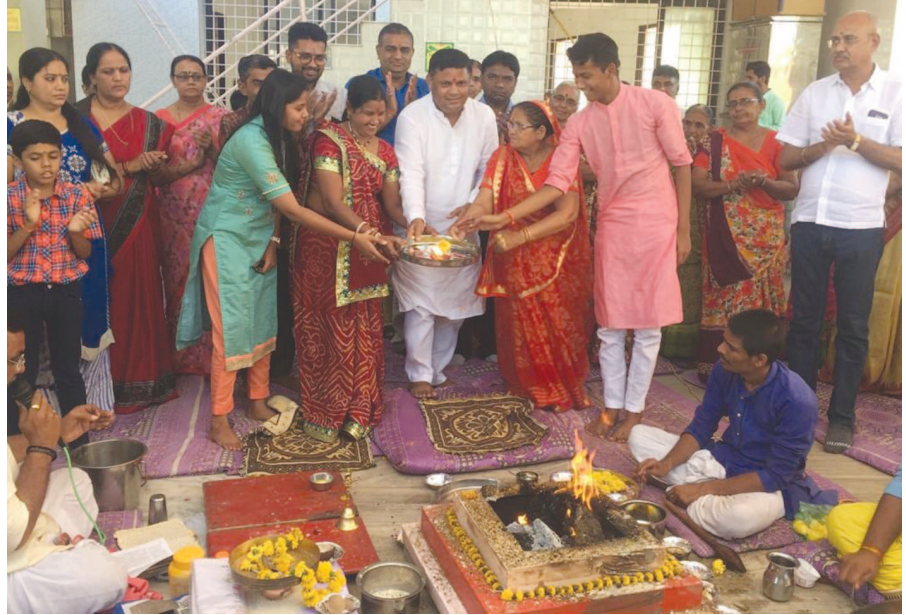
હિંમતનગર સહિત સાબરકાંઠા જિલ્લામાં શુક્રવારે ધામધૂમથી હનુમાન જયંતીની ઉજવણી કરાઈ હતી. હિંમતનગરના ઇપરિયા ચાર રસ્તે અને ખાડિયા ચાર રસ્તે હનુમાનજી મંદિરે મારુતિ હવન સાથે ઉજવણી કરાઈ હતી.

થી તાલુકાના સ્થાનિક પાયાના કાર્યકરો નિષ્ક્રિય બની ગયા છે અને સૂંટણી સમયે જ આગેવાનો ને રાજકીય વાહ ભણાવવા તેયારી આં કરી દીધી છે તાલુકા ના