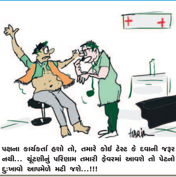
પક્ષના કાર્યકર્તા હશે તો, તમારે કોઈ ડેસ્ટ કે દવાની જરૂર નથી... ચૂંટણીનું પરિણામ તમારી ફેવરમાં આવશે તો પેટનો દુ:ખાવો આપમેળે મટી જશે...!!!