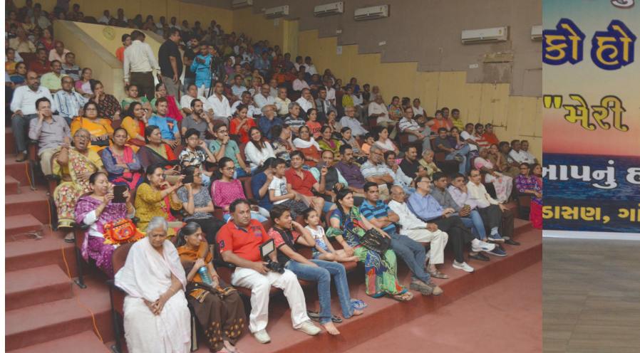
ગાંધીનગરમાં રવિવારની રાત્રિએ સેક્ટર-૧૨ માં ડો. આંબેડકર હોલ ખાતે શ્રી મનોરંજન મ્યુઝિકલ સ્ટુડીયો દ્વારા કરાઓકે સંગીત કાર્યક્રમ "જો તુમકો હો પસંદ વોહી ભાત કરંગે". યોજવામાં આવ્યો હતો. આ કાર્યક્રમમાં શહેરના અનેક કરાઓકે આર્ટિસ્ટોએ પોતાના સંગીતમય પરફોર્મન્સ આપ્યા હતા. ખીચોખીચ ભરાયેલા હોલમાં કલાકારોની સુમધુર પ્રસ્તુતિને શ્રોતાઓએ તાળીઓના ગડગડાટથી કલાકારોને બિરદાવ્યા હતા.