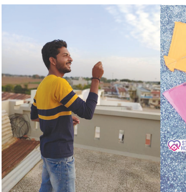
ચિલોડા, તા. ૩૧ કોરોના વાઈરસના સંક્રમણને અટકાવવા લોક ડાઉનના અમલવારી સંદર્ભે ઘરમાં રહો, સુરક્ષિત રહો ના સમર્થનરૂપે દરેગામ તાલુકાના નાંદોલ ગામના જાગૃત યુવાનોએ નવતર પ્રયોગમાં ૧૦ યુવાનોએ પોતપોતાના મકાનના ધાબા પરથી પતંગો ચગાવ્યા હતા.