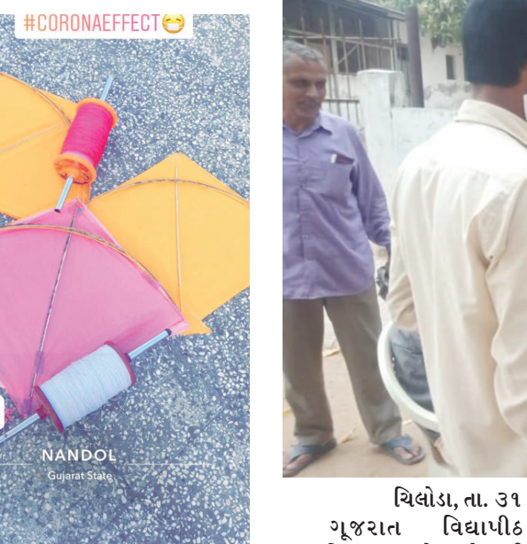
ચિલોડા, તા. ૩૧ ગૂજરાત વિદ્યાપીઠ સંચાલિત મહાદેવ દેસાઈ ગ્રામસેવા સંકુલ- સાદરાના સેવક કુટુંબોમાં આયુર્વેદિક ઉકાળો પીવડાવવામાં આવ્યો.