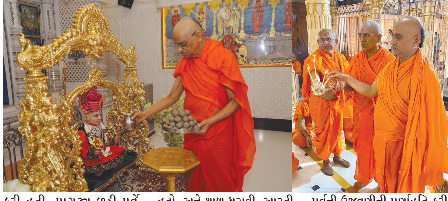
કરી હતી. પ્રાગટ્ય છઠ્ઠી પર્વ પૂજનીય સંતોએ ઉત્સવ કર્યો હતો. અને યાજ્ઞ ધરાવી, આરતી બાદ મહામંત્રની ધૂન સાથે આ પર્વની ઉજવણીની પૂજાહુતિ કરી હતી.

ગાંધીનગર, તા. ૭ ભારતમાં દિવસે દિવસે કોરોના મહામારીનો પ્રકોપ વધી રહ્યો છે અને લોકડાઉનને લીધે કેવળ સ્થાનિક સંતોની ઉપસ્થિતિમાં સાદાઈ અને ભક્તિસભર શ્રી સ્વામિનારાયણ ભગવાનના પ્રાગટ્ય જયંતીની છઠ્ઠીની ઉજવણી કરવામાં આવી હતી. ગુજરાત રાજ્યના મુખ્યમંત્રી વિજયભાઈ રૂપાણી તેમજ નીતિનભાઈ પટેલ તથા આપણાં ભારતના વડાપ્રધાન નરેન્દ્રભાઈ મોદી સતત ચિંતિત અને પ્રયત્નશીલ છે. તેઓ જે કોઈ સુચન કરે તે સ્વીકારી, હિંચત રાખી, આ કોરોના મહામારીનો જલ્દી નાશ થાય તેવી ભગવાન પાસે પ્રાર્થના કરીએ.