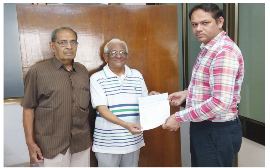
છેલ્લા ૨૫ વર્ષથી વધુ સમયથી સિનિયર સિટીઝન કાર્ડિન્સલ શહેરમાં સેવાકાર્ય કરી રહ્યું છે ત્યારે વર્તમાન પરિસ્થિતિને ધ્યાનમાં લઈને સંસ્થા દ્વારા પંચદેવ યુવક મંડળ દ્વારા થતા સેવાકાર્યમાં બે ટંકના ભોજન માટે દાન આપવામાં આવ્યું. જેનો લાભ ૧૦૦૦ જેટલા શ્રમિકો એ લીધો. આ ઉપરાંત સંસ્થા દ્વારા મુખ્યમંત્રી રાહત ફંડમાં રૂપિયા એક લાખનું દાન આપવા માં આવ્યું. આ ઉપરાંત સંસ્થા દ્વારા નગરજનો તથા સેવાકીય સંસ્થાઓને અપીલ કરવામાં આવી છે કે જરૂર પડે તો સંસ્થાનો સંપર્ક ૯૮૭૯૯૫૫૦૫૫/૭૯૯૯૦૩૨૪૫૩ નંબર પર અચૂકથી કરે સંસ્થા સેવા ક્યાં કરવા તૈયાર છે.