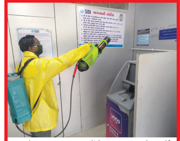
લોકડાઉનના સમયમાં બેંકોમાં કામ ચાલુ છે. આર્થિક વ્યવહારો જરૂરી હોઈ એટીએમ પણ ચાલુ છે. જો કે અહીં દરરોજ ઘણા લોકોની અવરજવર હોઈ એટીએમને પણ સેનેટાઈઝ કરવામાં આવી રહ્યા છે.