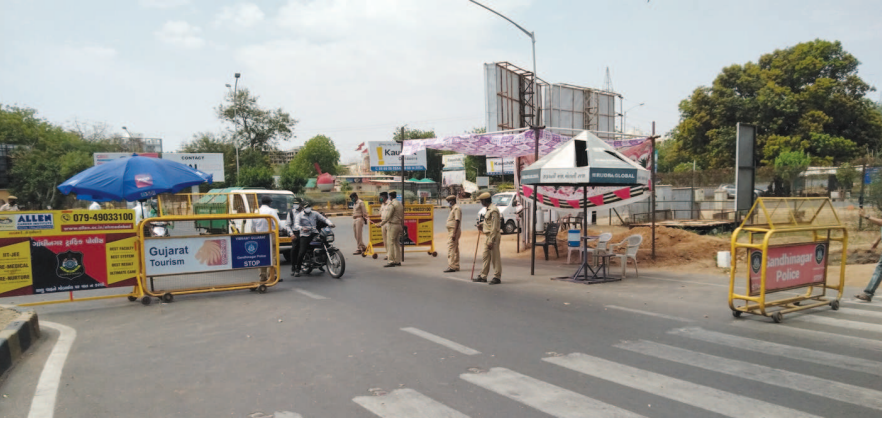
લોકડાઉનના પગલે જિલ્લાઓની સરહદો સીલ કરી દેવાઈ છે. રોગચાળો વધુ ન પ્રસરે તે માટે રક્ષાશક્તિ સર્કલે પોલીસ તહેનાત કરી દેવાઈ છે. તેઓ દિવસ-રાત આવતા જતા વાહનોનું સઘન ચેકીંગ કરી રહ્યા છે.