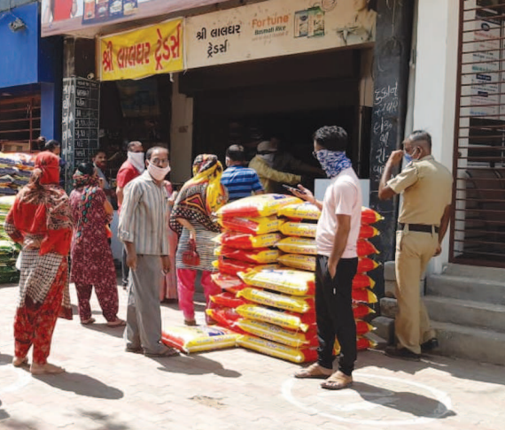
આખા વર્ષનું અનાજ અને મસાલા ભરવાની સીઝન ચાલી રહી છે. જો કે અત્યારે લોકડાઉનનો સમયગાળો હોવા છતાં સેક્ટર-૨૪ના શોપિંગ સેન્ટરમાં લોકો સિગ્નલ ઘઉં-ચોખા અને અન્ય ચીજવસ્તુઓ ભરાવવા આવી રહ્યા છે.

ગાંધીનગર, તા. ૧૫ ગુજરાતમાં કોરોના એ હાહાકાર મચાવ્યો છે. ત્યારે નાગરીકોની અવરજવર ઓછી કરવા માટે જાહેર સ્થળો પર તંત્રની અમલવારીના ભાગરુપે દર્શનાર્થીઓ માટે મંદિર અને સદાપ્રત તા. ૨૨ માર્ચથી બંધ કરી દેવાયું છે. સેક્ટર-૨૩ અને સેક્ટર-૨૮ માં ધ્યાને આવેલા કોરોનાના પોઝીટીવ કેસોની સંખ્યા જોતા તંત્ર દ્વારા મુકવામાં આવેલા નિયંત્રણોનું ચુસ્ત પાલન કરવું જાહેર