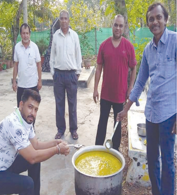
કોરોના વાઈરસને પગલે સર્જાયેલી હાલની પરિસ્થિતિને ધ્યાનમાં રાખીને નાગરિકોને કોરોના સામે લડવામાં મદદરૂપ થાય તે માટે અને શરીરમાં રહેલી રોગ પ્રતિકારક શક્તિ વધારવા માટે સેક્ટર ૩ ન્યુ ખાતે વસાહત મંડળ દ્વારા આયુર્વેદિક ઉકાળાના વિતરણનો કાર્યક્રમ હાથ ધરવામાં આવ્યો હતો.