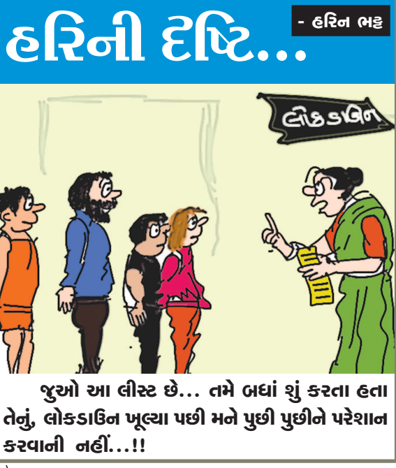
જુઓ આ લીસ્ટ છે... તમે બધાં શું કરતા હતા તેનું, લોકડાઉન ખૂલ્યા પછી મને પુછી પુછીને પરેશાન કરવાની નહીં...!!