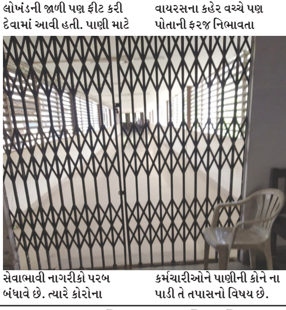
લોખંડની જાળી પણ ફીટ કરી દેવામાં આવી હતી. પાણી માટે વાયરસના કહેર વચ્ચે પણ પોતાની ફરજ નિભાવતા સેવાભાવી નાગરીકો પરબ બંધાવે છે. ત્યારે કોરોના કર્મચારીઓને પાણીની કોને ના પાડી તે તપાસનો વિષય છે.

કોરોના કહેર વચ્ચે પણ સિવિલમાં સિક્યુરીટી જવાનો અને ખાનગી એજન્સીના કર્મચારીઓ પોતાની ફરજ નિષ્ઠાપૂર્વક બજાવી રહ્યા છે. લોકડાઉનની કપરી પરિસ્થિતિમાં પણ કર્મચારીઓ ગમે તે રીતે હોસ્પિટલ નોકરી અર્થે આવે છે. ત્યારે સિવિલના આરએમઓ ઓફિસ નજીક આવેલા આરઓ પ્લાન્ટમાં પાણી ભરવા માટે સિક્યુરીટીના જવાનો અને ખાનગી એજન્સીના કર્મચારીઓ આવતા હોય છે. પરંતુ આ કર્મચારીઓને પાણી ભરવા માટે અહીં આવવું નહી તેમ સ્પષ્ટ પણે કહેવામાં આવ્યું છે. ત્યારબાદ ત્યાં આવેલી