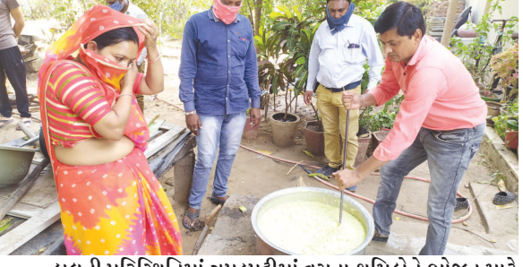
હાલની પરિસ્થિતિમાં ઝૂપડપટ્ટીમાં વસતા શ્રમિકોને ભોજન માટે સવાર સાંજ સંસ્થાઓ ભગીરથ કાર્ય કરી રહી છે. છેલ્લા એક અઠવાડિયાથી સેક્ટર ૭, ૨૧ મીના બજાર, ૨૪ અને ૨૮ નાં વિસ્તારના ઝૂપડપટ્ટી માં વસતા લોકોને ખીચડી-શાક આપવામાં આવી રહ્યું છે. આ સેવા કરતા વસાહતીઓ ભાઈ બહેનો દ્વારા સેવા કાર્યમાં જોડાવા અને કપરાં સમયમાં એકબીજાને મદદ કરવા આગળ આવવું જોઈએ.

ગાંધીનગર, તા. ૧૭ લોકડાઉનમાં બાળકો તથા નાગરિકો સર્જનાત્મકતા માટે સમયનો સદુપયોગ કરે તે હેતુથી ગુજરાત કોલિસલ ઓન સાયન્સ અને ટેકનોલોજી વિભાગના ઉપક્રમે નિર્સર્ગ સાયન્સ સેન્ટર દ્વારા આ સ્પર્ધાનું આયોજન કરવામાં આવેલ છે. જેમાં ખૂબ મોટી સંખ્યામાં વિદ્યાર્થીઓએ તથા નાગરિકોએ ભાગ લીધો. આ સ્પર્ધામાં પાંચ વિષયો પર ચિત્રો કે વીડિયો બનાવીને મોકલવાના હતા. જેમાં કેટેગરી-૧ માં ધોરણ-૧ થી ૮, કેટેગરી-૨ માં ધોરણ-૯ થી ૧૨ અને કેટેગરી-૩ માં શિક્ષકો, વિજ્ઞાન પ્રચારકો અને નાગરિકો ભાગ લઈ શકે તેવી જાહેરાત કરવામાં આવી હતી. સ્પર્ધાકોને પાંચ વિષય જેવા કે ૧. Covid-19 થી બચવાના ઉપાયો. ૨. અવેકાનિક વાયરલ મેસેજ નું ખંડન. ૩. રોગ પ્રતિકારક શક્તિ વધારવાના નુસખાઓ ૪. ઘરે રહો, સુરક્ષિત રહો માટેના સૂત્રો ૫. કોરોના વીરુસો માટેના માસકેટ ની ડિઝાઇન. વિષય પર ચિત્ર અને વીડિયો બનાવી મોકલવાનો હતો. આજ સુધી કેટેગરી-૧ માં ૮૬ ચિત્રો અને ૧૩ વીડિયો