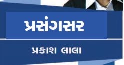
પ્રસંગસર પ્રકાશ લાલા

એટલે જ હવે આપણને સ્વચ્છતા, પર્યાવરણ જાળવણી માટે, કુદરતી સંપદાના અવિદ્યેકી ને બેફામ દુરુપયોગ સામે કાળજીપૂર્વક વર્તતા શીખી જવું પડશે... પ્રકૃતિએ જે કંઈ સજ્યું છે તે બધાનું મહત્ત્વ છે, બધાની આવશ્યકતા છે ને બધાં માટે છે એ સ્વીકારી બંધાએ છીએ, સંતુલન જાળવી આપણે આપણી 'લાઈફ સ્ટાઈલ' ઘડવાની રહેશે... તો જ ઈશ્વર રાજી રહેશે આપણી ઉપર... 'કોરોના' અને 'લોકડાઉન'ને શીખવેલો આ ખૂબ જ આવશ્યક ને અનિવાર્ય પદાર્થ પાઠ નથી શું? આપણે સુધરી જઈશું ને ?