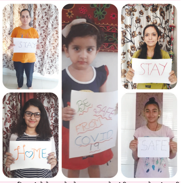
વિશ્વમાં કોરોના પ્રકોપને હરાવવા માટે ગાંધીનગર શહેરમાં વસતી પંડ્યા પરિવારની ટિકીટીઓએ Stay Home, Stay Safeનો સંદેશો આપ્યો હતો...

ભોજન તૈયાર કરવા માટે કરે છે અને પછી ઓથોરીટીએ જણાવેલ કેન્દ્રો પર પહોંચાડવામાં આવે છે. સાથોસાથ, દેશભરના જુદા-જુદા ભાગોમાં પેકીંગ સેન્ટરો પણ ઉભા કરવામાં આવ્યા છે જ્યાં ફૂડ રિલીફ પેકેટમાં સ્થાનિક સ્વાદ પ્રમાણે જરૂરી અનાજ-કરિયાણું પેક કરવામાં આવે છે. જેમકે બેંગલોરમાં વહેંચવામાં આવતી કીટમાં ચોખા,