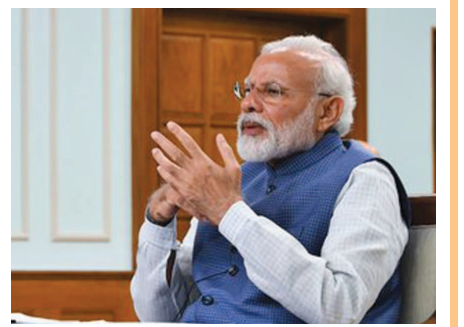
● અનુસંધાન પાન-૭ પર

નવી દિલ્હી, તા. ૨૨ કોરોના વાયરસના મહાસંકટની વચ્ચે લોકપ્રિયતાના મામલામાં વડાપ્રધાન નરેન્દ્ર મોદી વર્લ્ડ લીડરોને પછાડાટ આપી ચુક્યા છે અને પ્રથમ સ્થાન પર પહોંચી ચુક્યા છે. હાલમાં જ કરવામાં આવેલા સર્વેમાં જણાવવામાં આવ્યું છે કે, નરેન્દ્ર મોદીની લોકપ્રિયતા ૬૮ ટકા રહેલી છે જ્યારે ડોનાલ્ડ ટ્રમ્પની લોકપ્રિયતામાં ત્રણ ટકાનો ઘટાડો થયો છે. અમેરિકાની ગ્લોબલ ડેટા ઇન્ટેલીજન્સ